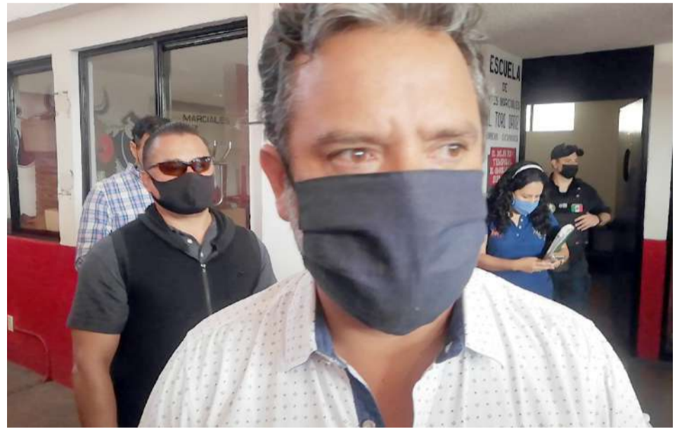
EL PRESIDENTE MUNICIPAL DE CUERNAVACA, Antonio Villalobos Adán, reconoció que se registró para buscar la reelección en la presidencia municipal de Cuernavaca, sin embargo, dijo que no dejará el cargo y concluirá su administración.

al cargo es buscar la reelección, además de que dijo que llegó a la presidencia por una coalición entre tres partidos políticos, mediante los cuales buscará volver a ser alcalde.