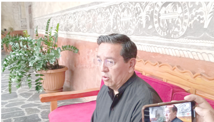
LA IGLESIA CATÓLICA llamó a la ciudadanía a seguir donando para damnificados por huracán Otis en el puerto de Acapulco en el estado de Guerrero.

En otro tema, Toral Nájera informó que, a más de seis años del sismo del 19 de septiembre del 2019, sigue pendientes la reconstrucción de los templos y once exconventos afectados por el movimiento telúrico, aunque recordó que el compromiso del Instituto Nacional Antropología e Historia (INAH) fue concluir los trabajos en este año.