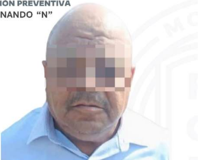
PRISIÓN PREVENTIVA FERNANDO “N”

teligencia, se determinó que Fernando “N”, es uno de los generadores de violencia en la zona Oriente del estado, específicamente en los municipios de Temoac, Zacualpan, Jonacatepec y Jantetelco, mediante la organización denominada “Los Aparicio”. Con estas acciones, la Fiscalía Morelos refrenda su compromiso en el combate a la impunidad, a través de acciones coordinadas con las instituciones estatales y federales, para garantizar el acceso de las víctimas a la procuración de justicia.