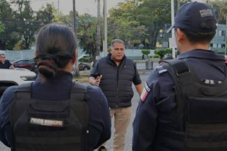
MARINA, Guardia Nacional y la Secretaría de Seguridad y Protección Ciudadana (SSPC), implementa el Operativo Navideño

De la Redacción La Secretaría de Protección y Auxilio Ciudadano (SEPRAC), en coordinación con la SEDENA,