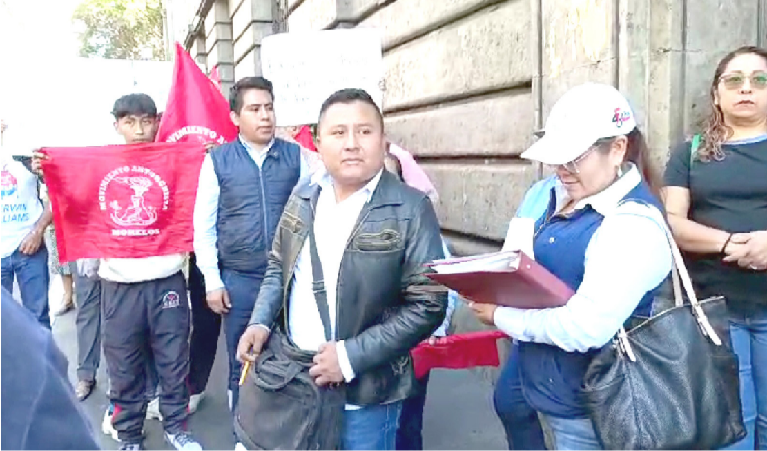
INTEGRANTES DEL MOVIMIENTO Antorcha Campesina se manifestaron la mañana de este martes en las instalaciones del Gobierno de Morelos para exigir que se les apoye con diversas obras en colonias de bajos recursos.