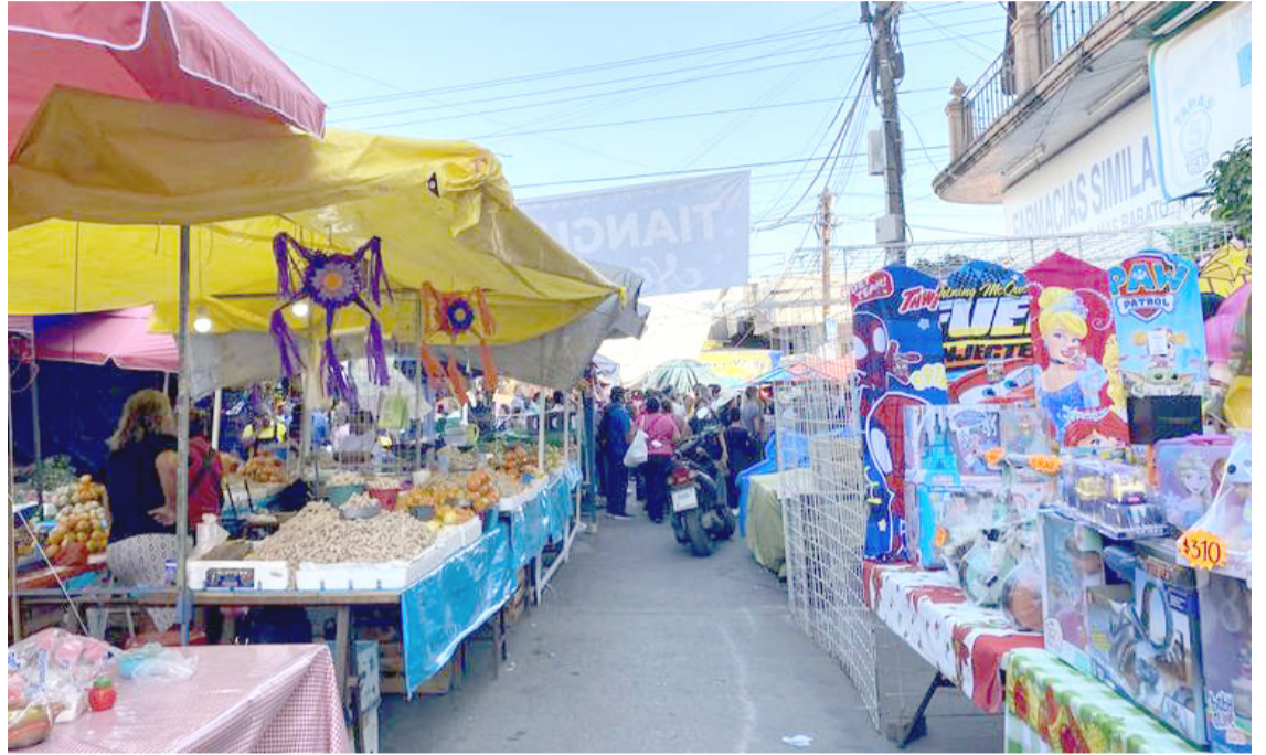
COMERCIANTE Y LOCATARIOS del mercado municipal Hermenegildo Galeana, de Cuautla, demandan reforzar la seguridad, tras los recientes actos de violencia contra algunos de sus compañeros.

gales ha llevado a ataques contra los negocios, y ahora, a agresiones directas contra los comerciantes.