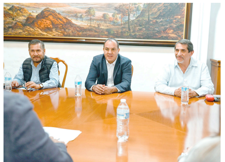
EL GOBERNADOR CUAUHTÉMOC Blanco Bravo encabezó una reunión, en la que dieron seguimiento a la consolidación del proceso de transición de Servicios de Salud de Morelos y del Hospital del Niño Morelense hacia el modelo sanitario IMSS-Bienestar.