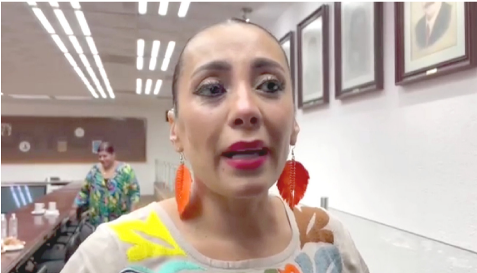
LA DIRECTORA DEL Instituto de Crédito para los Trabajadores al Servicio del Estado, Fabiola del Sol Urióstegui, hizo un llamado a los trabajadores que no han pagado sus créditos para ponerse al corriente y aprovechar una campaña de descuentos.

“Estamos esperando una temporada de estiaje bastante complicada pero estamos buscando alternativas, estamos trabajando para ver de qué forma podemos garantizar el abasto de agua, que los campos no se queden sin este vital líquido, estamos teniendo reuniones con diversas autoridades pero ya estamos trabajando ante la temporada de estiaje que se aproxima y que se espera que pueda ser fuerte”, concluyó Juárez López.