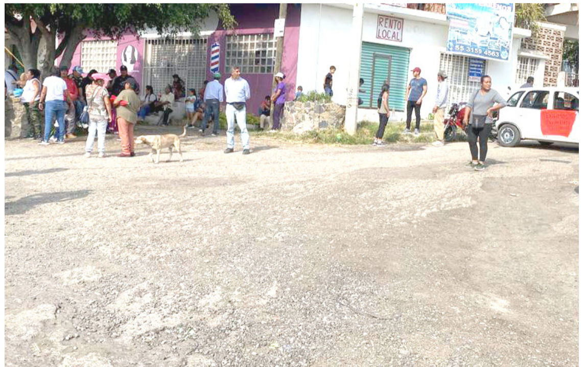
LA COMUNIDAD DE Cazahuates enfrenta un serio conflicto de intereses debido a que es única con desconocimiento sobre su pertenencia a uno de tres municipios.

Por esta ocasión, confiarán en el diálogo con las autoridades de los tres municipios que los unen, así como explicarán cuáles son sus necesidades; además piden ser reconocidos como colonia de alguna localidad que se une en este punto, que es Tlayacapan, Atlatlahucan y Yautepec. En la reunión se dará claridad sobre la situación de la comunidad y los servicios de pavimentación que necesitan.