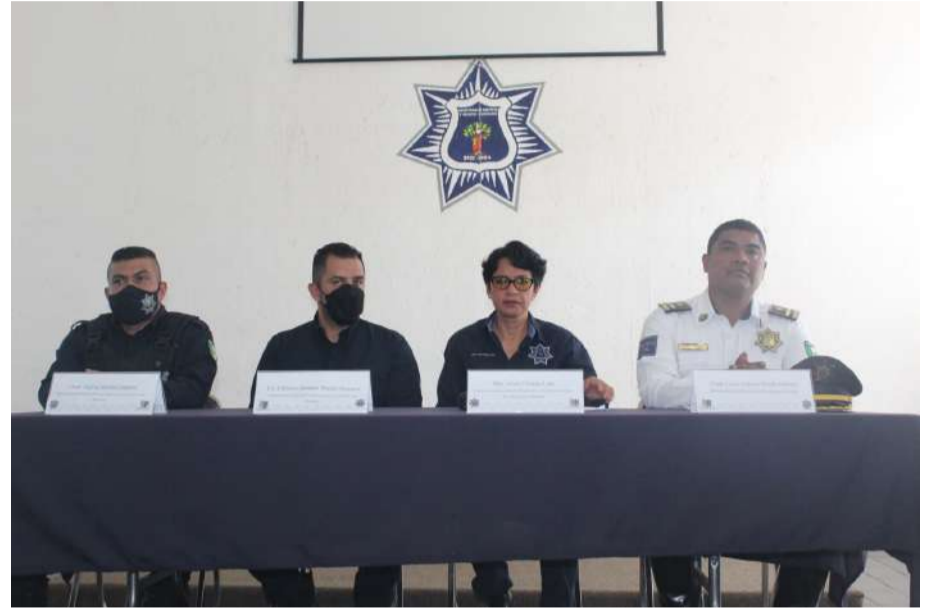
LOS GOBIERNOS de Cuernavaca y de Querétaro, de manera coordinada presentaron la aplicación móvil para prevenir la extorsión en la capital de Morelos.

este tipo de modus operandi, lo que demuestra que los cuernavacenses no están acostumbrados a reportar las extorsiones.