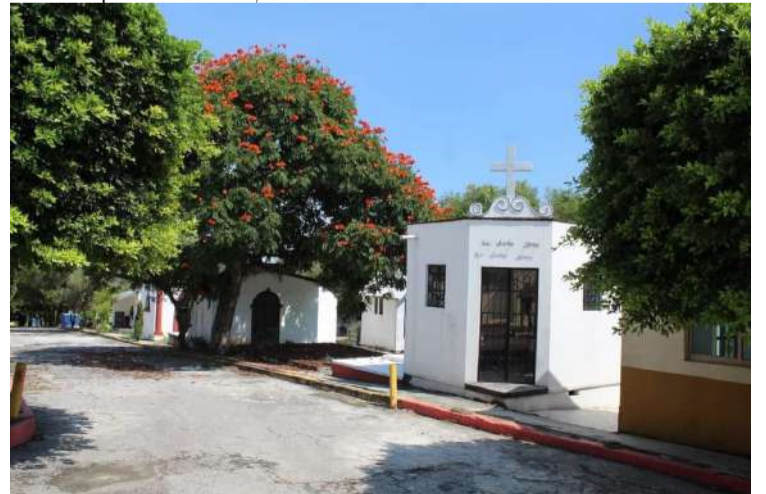
AUTORIDADES DEL AYUNTAMIENTO de Jiutepec hicieron un llamado a los ciudadanos que acudirán a visitar los panteones de este lugar, a utilizar las medidas sanitarias en contra del covid-19, así como evitar estar tiempos prolongados para evitar enfermedades.

viembre son aquéllos cuando la población tiene una mayor costumbre de asistir a dichos lugares la autoridad municipal insistió en la necesidad de hacer un esfuerzo por cumplir con los cuidados sanitarios referidos.