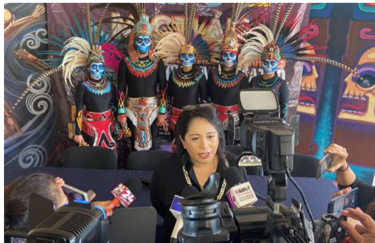
LA ESCUELA DE TEATRO, Danza y Música (ETDM) de la Universidad Autónoma del Estado de Morelos (UAEM), anunció que realizará en sus instalaciones, una representación interactiva del Camino al Mictlán.

La convocatoria es para que los interesados acudan a la explanada de la ETDM de la UAEM, que se localiza en avenida Morelos esquina con calle Jorge Cázares, en la colonia Centro de Cuernavaca, el próximo domingo a las 18 horas con actividades que continuarán los días 31 de octubre y el 1 de noviembre.