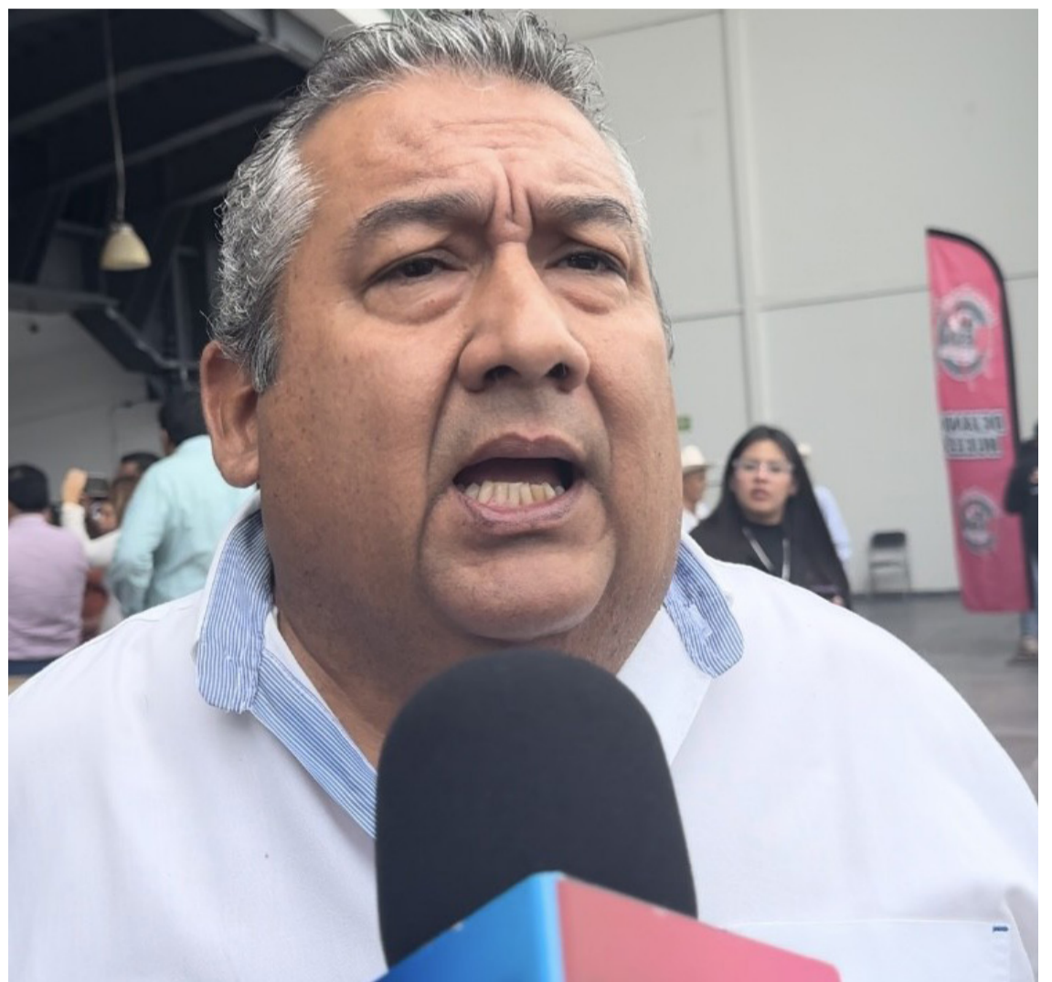
TRAS EL DESPLOME de ventas, comerciantes esperan una recuperación económica durante la feria más importante del año de la región sur de Morelos; la tradicional Feria de Año Nuevo en Jojutla, de acuerdo con Canaco- Servitur de Jojutla.

“Esperamos un aumento en nuestras ventas de hasta el 50 por ciento y si no se logra, mantener nuestras ventas equilibradas”, agregó.