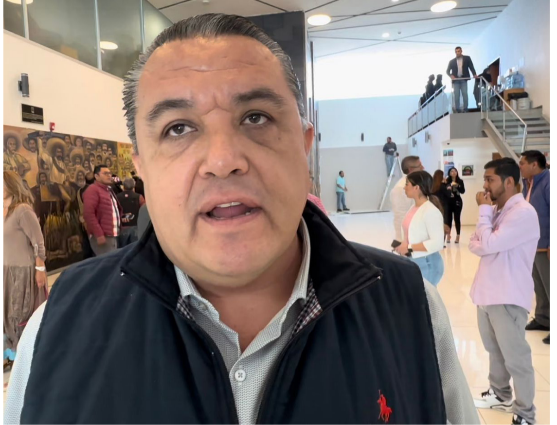
EL SECTOR ECONÓMICO de Cuernavaca hizo un llamado al Gobierno del Estado para ampliar la base tributaria para mejorar la recaudación de impuestos en la entidad.