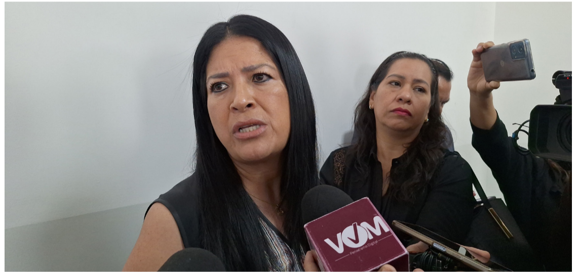
MORELOS BUSCA RECAUDAR 468 millones de pesos de impuesto en el 2025, informó la titular de la Secretaría de Hacienda, Mirna Zavala Zúñiga.

"Lo importante es tener sensibilidad y trabajar de manera coordinada con las instituciones para seguir generando bienestar para los morelenses. Estos esfuerzos permitirán continuar planeando acciones de infraestructura y programas sociales", afirmó Zavala. Según la secretaria, se proyecta captar alrededor de 400 millones de pesos adicionales para financiar estas iniciativas, siguiendo las instrucciones de la gobernadora.