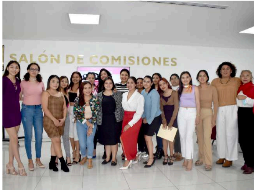
ESTUDIANTES DE LA LICENCIATURA de ciencias políticas de la Facultad de Derecho y Ciencias Sociales de la Universidad Autónoma del Estado de Morelos (UAEM), exigieron espacios de participación y respeto a sus derechos humanos.

Expresó una joven estudiante de la licenciatura de ciencias políticas de la Universidad Autónoma del Estado de Morelos.