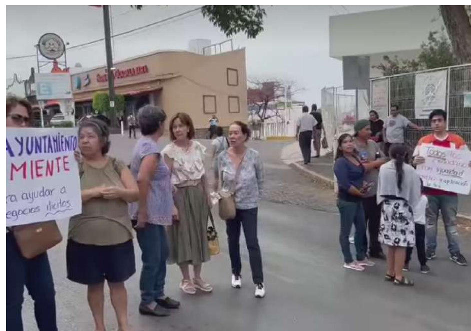
VECINOS DE LA COLONIA Jardines Las Delicias del municipio de Cuernavaca, se manifestaron la mañana de este lunes para protestar en contra del Ayuntamiento, quien pretende retirar una reja que vecinos instalaron bajo el argumento de sufrir de la inseguridad.