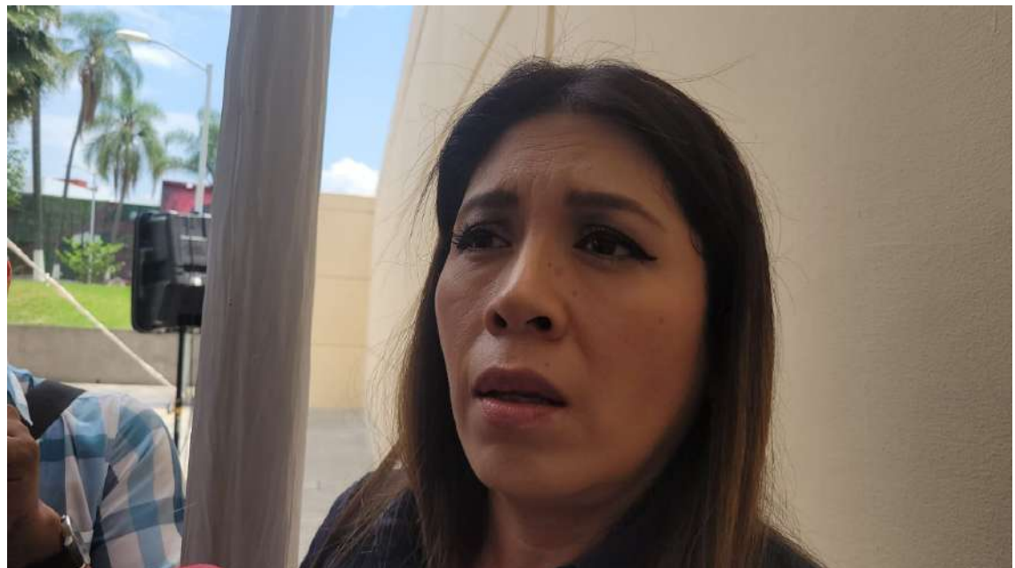
MÁS 58 FOSAS clandestinas localizadas en Morelos. Además la entidad se ubica a nivel nacional en el octavo lugar por el número de personas desaparecidas.

Además, la funcionaria estatal se sumó a la propuesta de reforma de ley para la creación de las Unidades de Derechos Humanos, Búsqueda de Personas Desaparecidas ante el Congreso del estado.