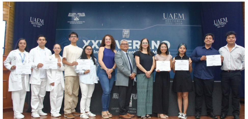
EN LA EXPLANADA de la Torre Universitaria de la UAEM, concluyeron los trabajos del XXVI Verano de la Investigación Científica en Morelos, con una exposición de 55 carteles resultado de la investigación conjunta entre estudiantes y 39 profesores investigadores.

Si se logra la creación y consolidación del Instituto Morelense de Medicina Tradicional, se espera controlar y atender las enfermedades que aquejan a la ciudadanía en la entidad.