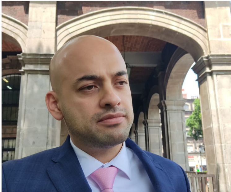
LA COMISIÓN DE Transición del gobierno electo de Margarita González Saravia solicitó al gobierno saliente de Cuauhtémoc Blanco Bravo información para comenzar con la elaboración del Paquete Económico 2025.