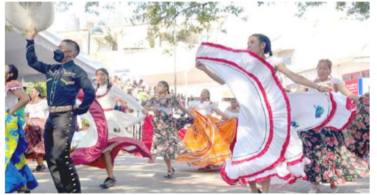
ESTUDIANTES DE LA Universidad Pedagógica Nacional ubicada en la colonia Ejidal Olinitepec, del municipio de Ayala, participaron en el desfile cívico-militar por la conmemoración del 112 aniversario de la promulgación del Pan de Ayala.