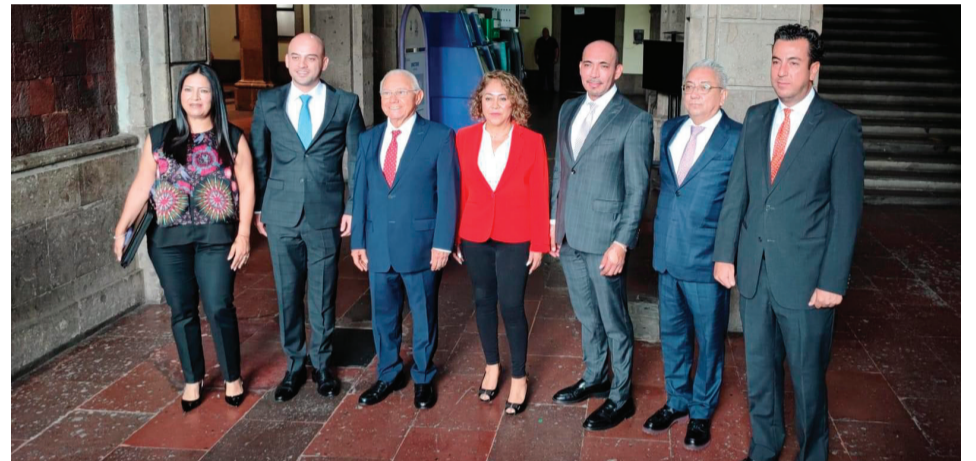
ESTE VIERNES SE instaló la mesa de transición entre el gobierno de Cuauhtémoc Blanco Bravo y la próxima administración de la gobernadora electa, Margarita González Saravia.

Los padres de familia junto con los directivos y personal docente, se reúnen con la finalidad de que modo resolver cuando se perpetran robos en las escuelas.