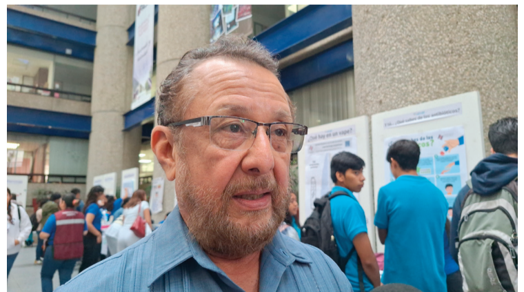
EN LO QUE va del año, los casos de dengue en Morelos se quintuplicaron, en comparación con el 2023, reveló Francisco Betanzos Reyes, investigador del Centro de Enfermedades Infecciosas del Instituto Nacional de Salud Pública (INSP).

Betanzos Reyes, llamó a la población acudir al médico, ante los primeros síntomas "ya que de lo contrario corre el riesgo de agravar su estado de salud e incluso, el riesgo de muerte".