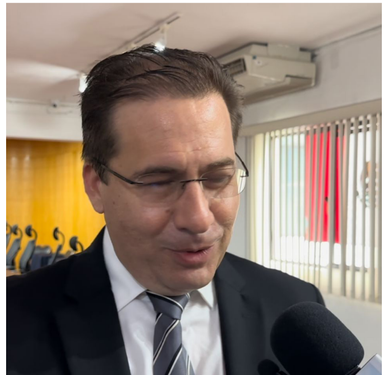
LA PLATAFORMA DIGITAL que creó el Impepacdenominada “Conóceles”, continuará vigente para que los ciudadanos puedan verificar que quienes llegaron a los puestos de elección popular, cumplan con sus promesas de campaña.