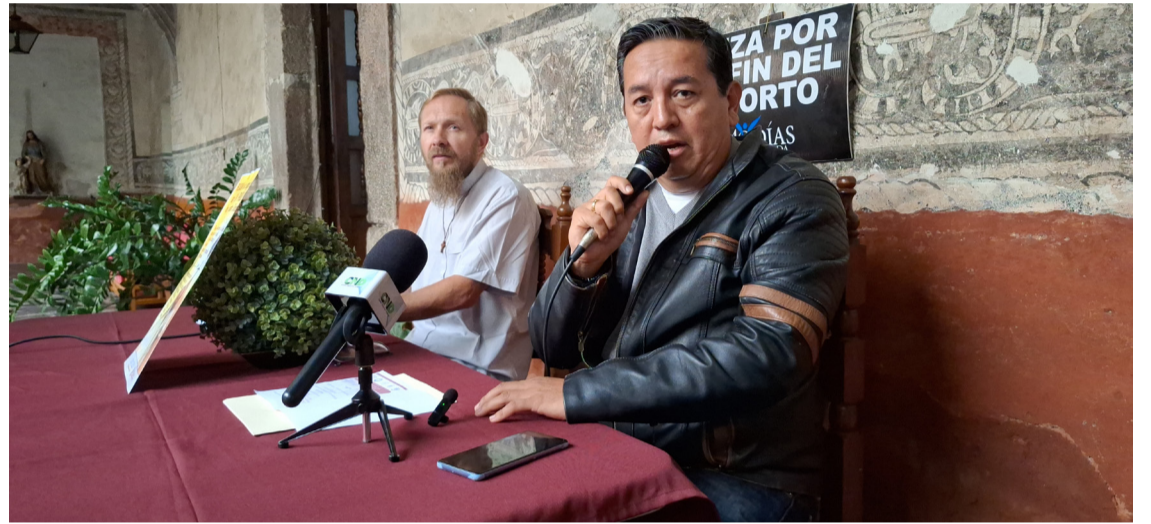
IGLESIA CATÓLICA PIDIÓ a la ciudadanía tener esperanza ante la llegada del nuevo gobierno de Margarita González Saravia.

de la sociedad para enfrentar las condiciones actuales que presenta la seguridad en Morelos y lograr un estado en armonía. Además, destacó el compromiso mutuo de continuar el diálogo y fortalecer las acciones conjuntas.