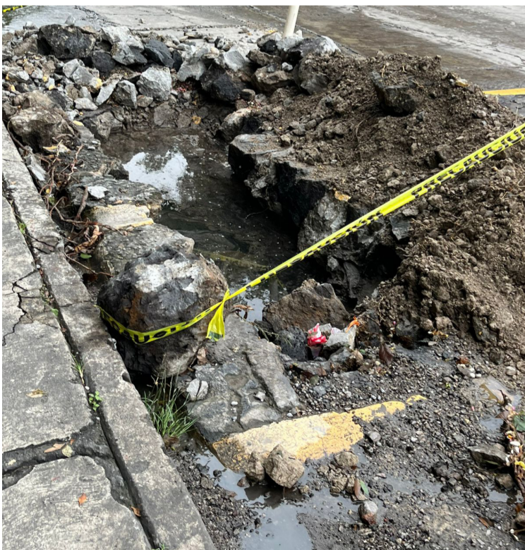
CONDICIONES DEPLORABLES TIENEN que enfrentar los alumnos de la Universidad Internacional (Uninter) en Cuernavaca, para asistir a sus clases a causa del mal estado de la calle San Jerónimo.