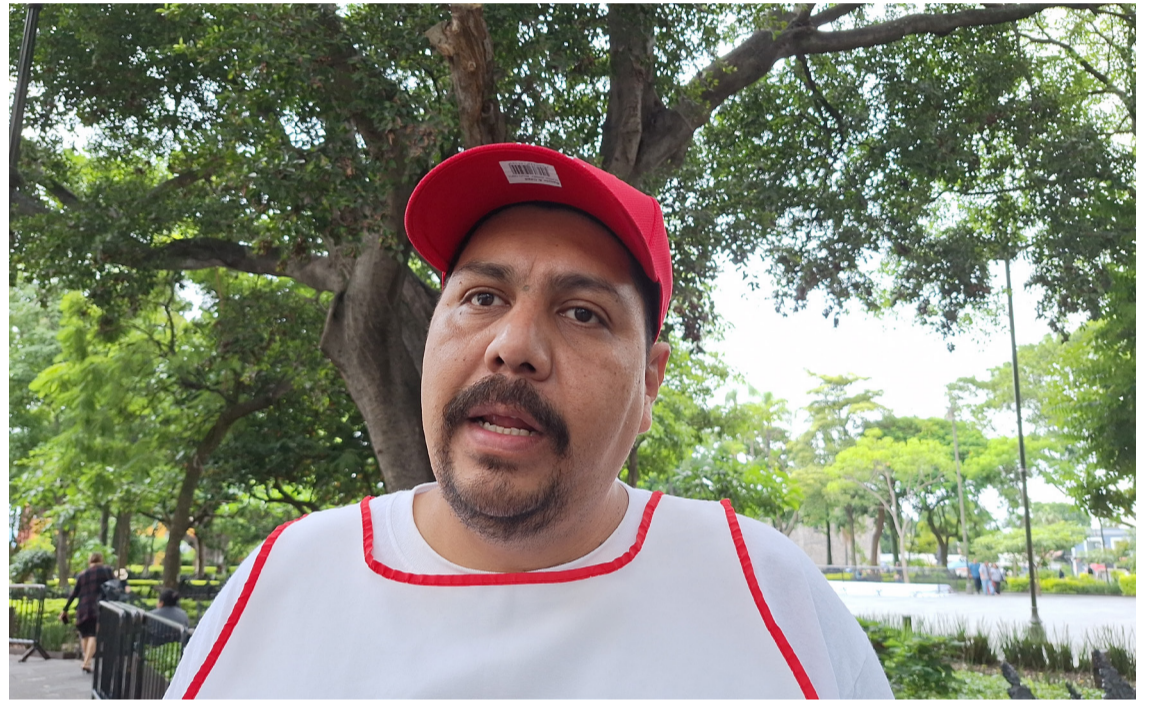
LA CRUZ ROJA Mexicana en Morelos aseguró que lista para apoyar a la población ante afectaciones por lluvias.

Tanto los universitarios como los padres de familia solicitan a las autoridades educativas de la Uninter, establecer las clases en línea mientras finaliza la temporada de lluvias y ciclones tropicales que están azotando en varias partes de México.