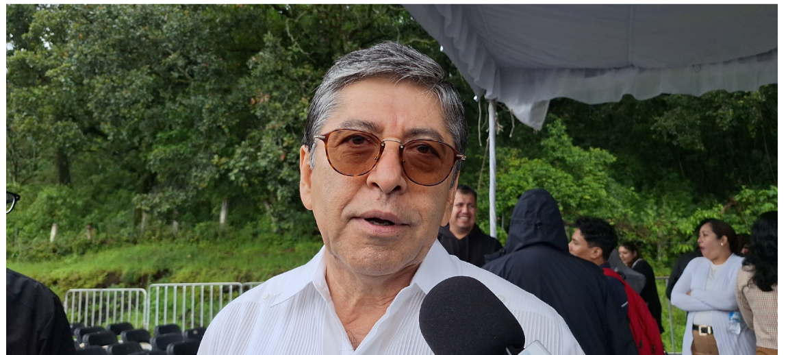
LA SECRETARÍA DE Infraestructura, Comunicaciones y Transporte (SICT) detectó baches en la Autopista Siglo XXI, pero, indicó que no hay recurso para su mantenimiento.