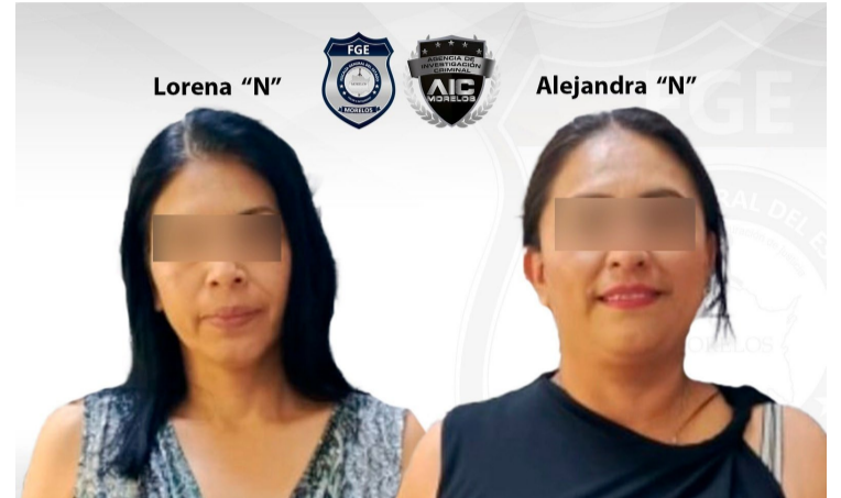
Se presumen inocentes, mientras no se declare su responsabilidad por autoridad judicial. Art. 13 CNPP

titucional por lo que su situación jurídica será resuelta las próximas horas, en tanto, permanecerán en prisión preventiva oficiosa como medida cautelar.