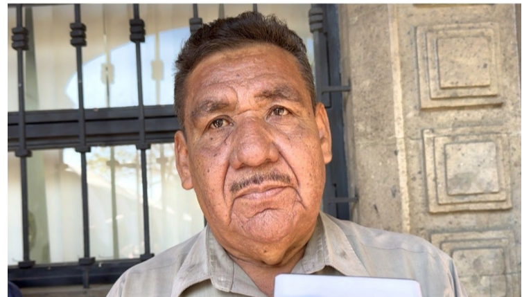
PROFESORES DEL MOVIMIENTO Magisterial de Bases Morelos (MMB), amagan con un paro de “brazos caído”, el próximo viernes, para exigir la eliminación de la Unidad del Sistema para la Carrera de las Maestras y los Maestros (USICAMM).

Por lo que, hacen un llamado al Ayuntamiento del pueblo mágico para clausurar los trabajos de la construcción, y que la CONANP proceda a levantar una denuncia.