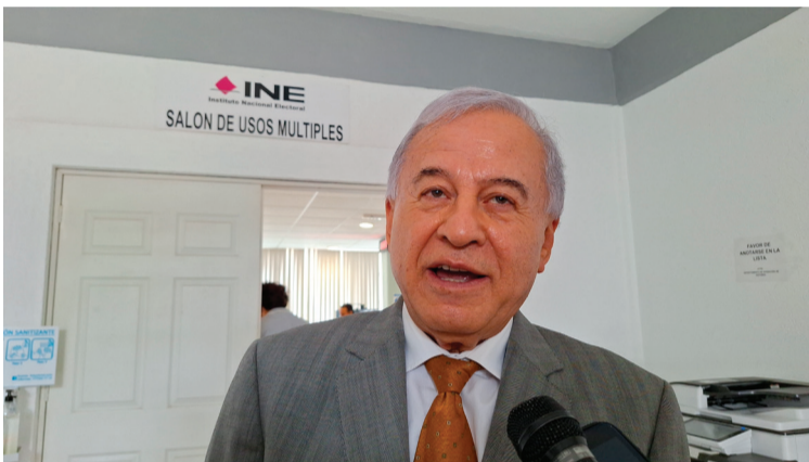
EN MORELOS EXISTEN condiciones de seguridad para salir a votar el próximo 2 de junio, aseguró Dagoberto Santos Trigo, vocal ejecutiva de Instituto Nacional Electoral (INE).

También el delegado del Instituto, llamó a la ciudadanía participar "de la fiesta democracia del 2 de junio".