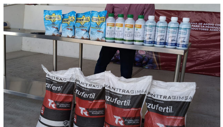
LA SECRETARÍA DE Desarrollo Agropecuario (Sedagro), mantiene acciones de atención y solución a las necesidades de las y los productores para la capitalización de las unidades de producción en los municipios de Miacatlán y Tlaltizapán.