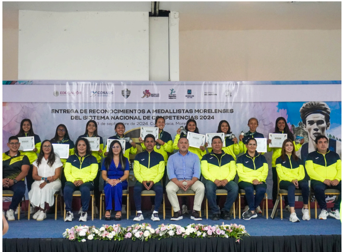
SIENDO PROTAGONISTAS DENTRO del terreno de juego, la selección morelense de fútbol 7 femenino conquistó medalla de plata en el Encuentro Nacional Deportivo Indígena 2024, efectuado en San Francisco de Campeche.

En el Encuentro Nacional Deportivo Indígena 2024, Morelos también compitió en deportes como voleibol, básquetbol y atletismo; esta competencia es impulsada por la Comisión Nacional de Cultura Física y Deporte (Conade) y es enfocada a municipios indígenas o pueblos regidos por usos y costumbres. La administración 2018-2024 del Indem encabezada por Germán Villa Castañeda, siempre respaldó a las y los deportistas de dicho sector.