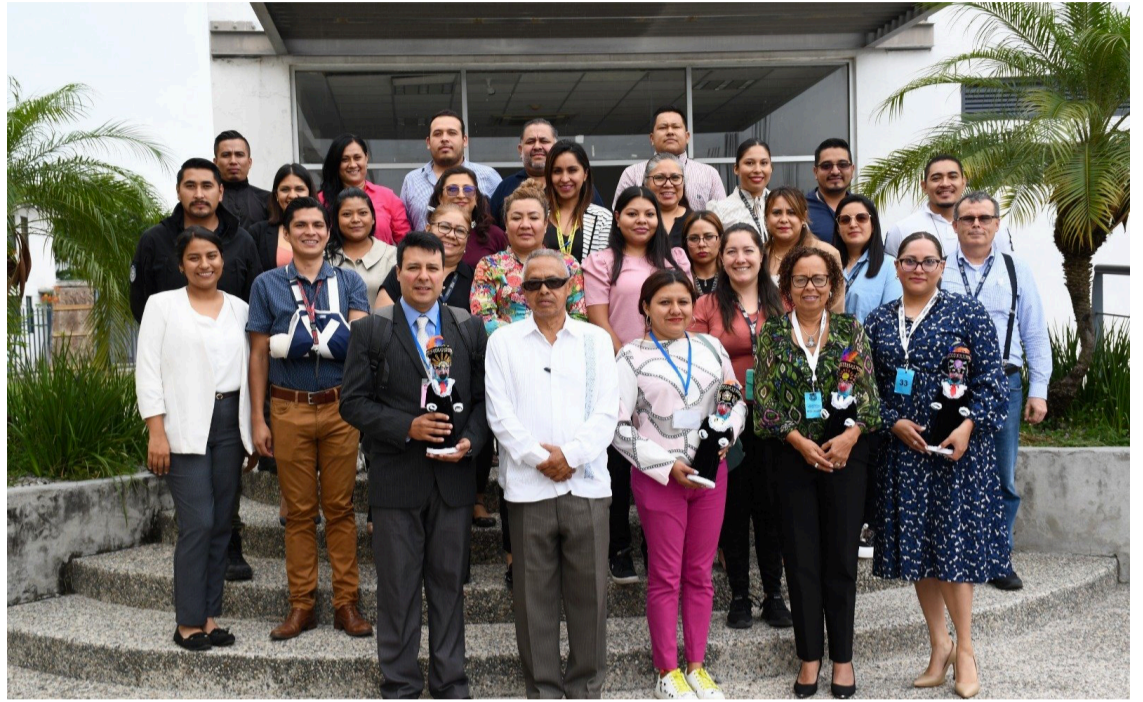
LA FISCALÍA GENERAL del Estado de Morelos, obtuvo la acreditación de las áreas de lofoscopia, balística, criminalística de campo, genética y química, por parte del organismo acreditador internacional ANAB, con lo que se certifica la operación de los mismos.

Es importante destacar que la Junta Nacional de Acreditación del Instituto Nacional Americano de Normas (ANSI) supervisa Las Actividades De Evaluación de Normas y Conformidad en los Estados Unidos de Norteamérica, y es a través de la organización no gubernamental ANAB otorga servicios de acreditación y capacitación, misma que brinda servicios en más de 80 países para la acreditación forense de más de dos mil 500 organizaciones con certificación internacional.