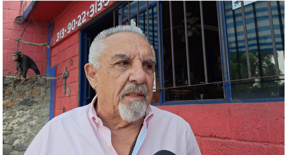
EN MORELOS OPERAN bandas dedicadas al delito "montachoques", alertó el Consejo Ciudadano de Seguridad Pública.

Finalmente, el funcionario estatal indicó que según estimaciones se proyecta en la propuesta de egresos del 2025 un incremento del 3%.