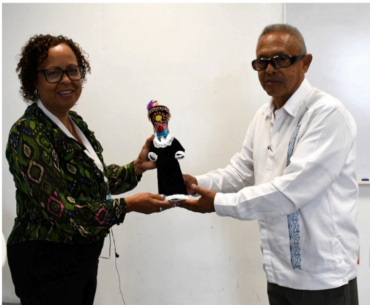
LA FISCALÍA GENERAL del Estado de Morelos, obtuvo la acreditación de las áreas de lofoscopia, balística, criminalística de campo, genética y química, por parte del organismo acreditador internacional ANAB, con lo que se certifica la operación de los mismos.