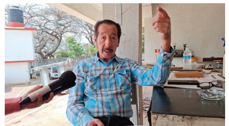
AUTOMOVILISTAS DEJARON de circular por las noches y madrugadas sobre la autopista México-Cuernavaca por inseguridad, la autopista a la altura de Huitzilac se ha convertido en un “foco rojo” en material seguridad.

Informó que en el operativo de seguridad de Semana Santa participa la Guardia Nacional (GN), y otras instituciones de auxilio, así como Caminos y Puentes Federales (Capufe) con más de cuatro mil personas.