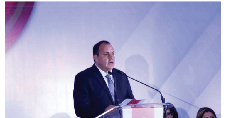
EL GOBERNADOR DE MORELOS, Cuauhtémoc Blanco Bravo, tiene hasta el 3 de abril para separarse del Poder Ejecutivo para continuar como candidato a la diputación federal plurinominal por el Movimiento de Regeneración Nacional (Morena).

del Poder Judicial de la Federación, resolvió la impugnación presentada por el Partido Revolucionario Institucional, Partido Acción Nacional y el Partido de la Revolución Democrática, en contra de la candidatura a la diputación federal plurinominal de Cuauhtémoc Blanco, en donde se estableció que el mandatario estatal debería separarse del cargo para buscar dicho cargo.