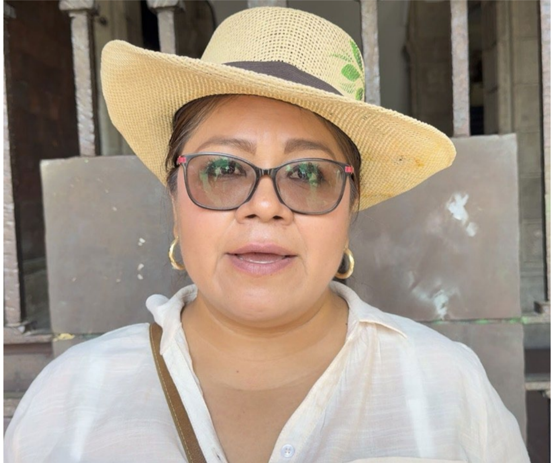
EL GOBIERNO DE Cuauhtémoc Blanco Bravo dejó en crisis y hambruna al campo morelense, así lo denunció el Movimiento Antorchista en Morelos.

Por lo que, pidió a la mandataria estatal Margarita González Saravia para otorgar el apoyo necesario al campo morelense y que no se repita la misma historia, a fin de “velar por las necesidades de los pueblos humildes”.