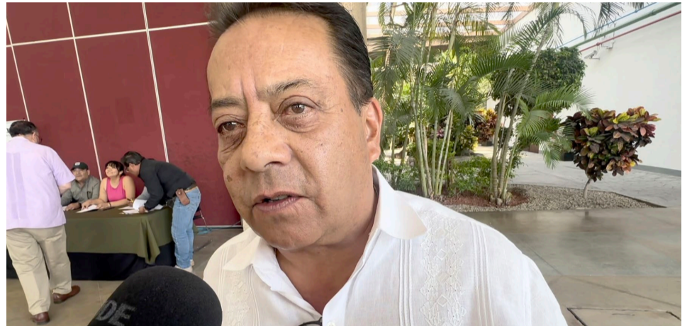
HOTELEROS DE MORELOS esperan una ocupación hotelera de hasta el 70 por ciento durante la próxima temporada de vacaciones de Semana Santa.

En otro tema, informó que de momento no tienen contemplando prórrogas para el pago de Reflendo Vehicular para que a partir de mayo inicie el pago de la tenencia, porque aseguró que con las medidas que implementarán se agilizará la atención y servicio, lo anterior a pesar de que solo existe un avance del 25 por ciento del padrón vehicular que refrendado.