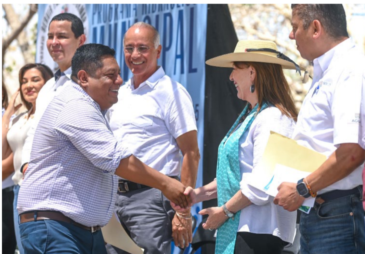
LA GOBERNADORA MARGARITA González Saravia acudió como invitada de honor a la inauguración del pozo de agua en la comunidad de Tapalehui, ubicada en el municipio indígena de Xoxocotla. Con esta acción cientos de familias tendrán acceso directo a este recurso natural.

Finalmente, destacó que su administración se coordina con las autoridades municipales y federales para atender los rezagos y asegurar el acceso a los servicios básicos que mejoran la calidad de vida de la población, lo que impulsa el desarrollo en diferentes sectores.