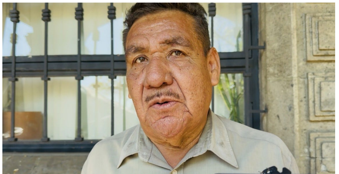
EL MOVIMIENTO MAGISTERIAL de Bases Morelos (MMB), detecta la zona metropolitana de Cuernavaca, oriente y sur del estado, con mayor índice de inseguridad que pone en riesgo a la población estudiantil de los planteles educativos de nivel básico.

Mencionó que, en el oriente de Morelos como Jonacatepec y Axochiapan también se reportan hechos delictivos en las inmediaciones de las instituciones educativas de nivel básico, ya que, se han presentado enfrentamientos y cobro de piso a comerciantes aledaños a las escuelas.