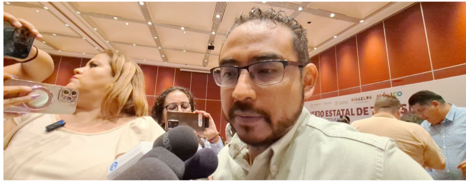
EL INCENDIO EN el barrio de Santo Domingo en Tepoztlán pudo ser provocado, dijo el presidente municipal Perseo Quiroz Rendón.

Finalmente, informó que se instaló el Centro de Mando de Tepoztlán con todas las autoridades municipales, estatales y federales.