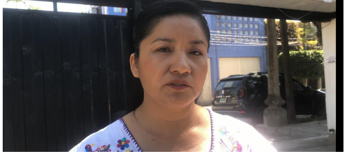
DIPUTADA MACRINA Vallejo Bello.

lograr la reelección en el Congreso local confiada en su trabajo y reafirmando su compromiso con los principios y valores del partido, haciendo caso omiso a las intensas críticas a su trabajo como legisladora.