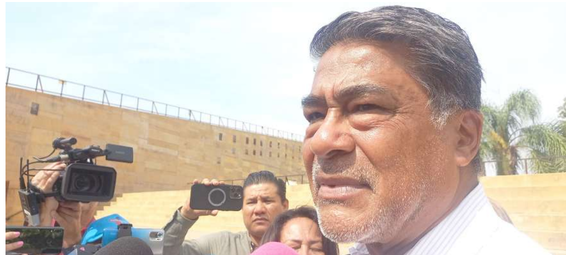
EL DIRECTOR DEL INSTITUTO de Educación Básica del Estado de Morelos (IEBEM), Eliacín Salgado de la Paz pidió a los cárteles de la delincuencia no meterse con maestros porque son profesionales que se dedican a hacer su trabajo.

Sin embargo, el funcionario estatal afirmó que se reforzará la seguridad en las escuelas, y se tendrá presencia de elementos del Ejército Mexicano en la escuela "Revolución".