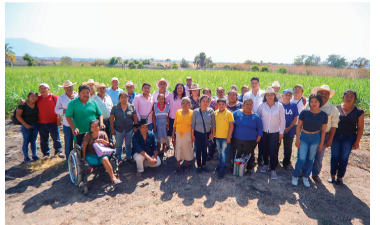
DURANTE UNA VISITA al municipio indígena de Xoxocotla, Margarita González Saravia aseguró que uno de los objetivos de la transformación es seguir creando oportunidades para que el bienestar llegue a todos y todas, pero en especial a las comunidades indígenas.

Durante el recorrido Margarita González Saravia visitó la granja acuícola “Campo Inglés” en Xoxocotla, fundada desde hace 19 años. Morelos cuenta con 600 granjas de crianza de tilapia y peces de ornato, sólo esta empresa morelense genera 3 millones de crías al año, lo que representa una derrama económica importante para la región, es una alternativa para impulsar la economía en la comunidad indígena de Xoxocotla.