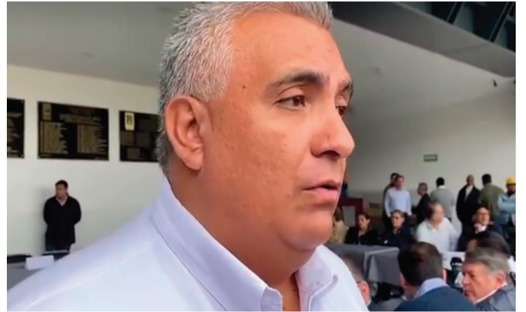
A PESAR DE los hechos de inseguridad que se han registrado en los últimos días, comerciantes de Cuernavaca esperan un aumento en las ventas de alrededor del 40 por ciento durante estas vacaciones de Semana Santa.

“A pesar de todo esto que sucede en materia de seguridad, de la mala imagen que generan las balaceras, sí estamos esperando que los visitantes vengan a Cuernavaca, que disfruten de los diferentes atractivos turísticos, estamos hablando de un aproximado de 40 por ciento de incremento de ventas en los próximos días, será bueno para todo el sector empresarial”, concluyó López Laguardia.