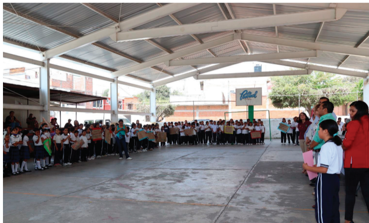
EL PROGRAMA, OPERADO por personal del Sistema para el Desarrollo Integral de la Familia (DIF) Jiutepec, tuvo su inicio con estudiantes del turno vespertino de la escuela primaria pública “Benito Juárez” ubicada en la colonia Jardín Juárez.

Los programas implementados por la administración municipal y sus organismos son públicos, ajenos a cualquier partido político; queda prohibido su uso para fines distintos a los establecidos en los programas. Material de carácter informativo.