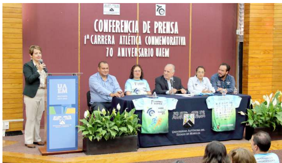
ANUNCIAN LA 1ª Carrera atlética conmemorativa por el 70 aniversario de la creación de la Universidad del Estado de Morelos.

Los premios serán en efectivo por categoría y rama; al primer lugar 2 mil pesos; segundo lugar, mil 500 pesos y tercer lugar, mil pesos. La convocatoria y el código QR de registro se puede encontrar en la página institucional: www.uaem.mx , o a través de la página de Facebook: Dirección de Deporte UAEM. La participación en la carrera consta de una cuota de recuperación, con la cual recibirán un paquete de playera conmemorativa, número, medalla, hidratación, fotografía de llegada, tiempos y resultados, los cuales se entregarán el sábado 29 de abril, en la explanada del Gimnasio Auditorio de la UAEM, 8 a 16 horas.