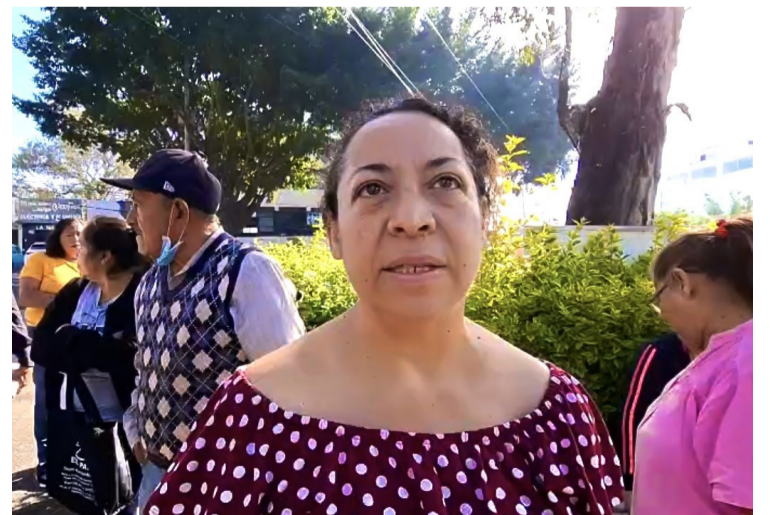
VECINOS QUE SUFREN problemas del servicio de agua potable desde hace más de una semana y media en la colonia Loma Linda, acusan al Sistema de Agua Potable y Alcantarillado de Cuernavaca.

Si bien, existe la promesa de la autoridad municipal de realizar las acciones pertinentes para evitar problemas de escasez del agua en la colonia Loma Linda, pero en dado caso de que no se cumpla con dicho compromiso, los vecinos afectados procederán a bloquear las calles en los días posteriores.