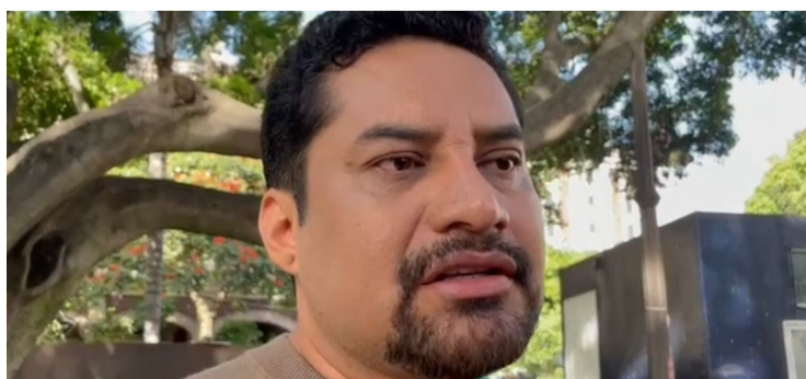
EL FORO MORELENSE de Abogados, solicitó al Congreso del estado cambiar al titular de la Entidad Superior de Auditoría y Fiscalización (ESAF).