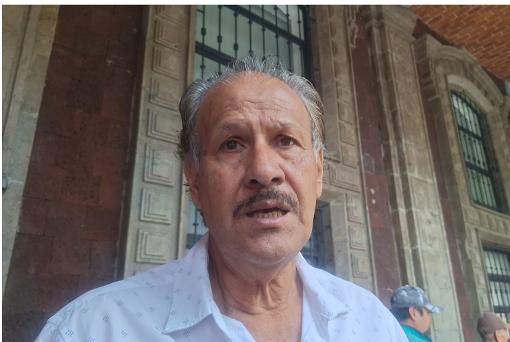
TRANSPORTISTAS INSISTIRÁN EN una ajuste al pasaje público de pasajeros antes de que concluya el año.

"Ya lo hemos planteado desde años pasado. Es un tema que se quedó pendiente desde el gobierno anterior, necesitamos plantearlo en mesa para ver la posibilidad del aumento en el pasaje porque la situación económica en la que opera el transporte y lo que estamos recibiendo de ganancia", dijo.