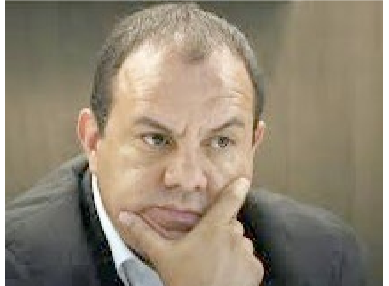
CUAUHTÉMOC BLANCO BRAVO, exgobernador de Morelos y actual diputado federal por Morena, se encuentra nuevamente en otro escándalo político-económico.

dades detectadas. En caso de no hacerlo, la ASF podría presentar denuncias penales en contra de los responsables de estos actos de corrupción.