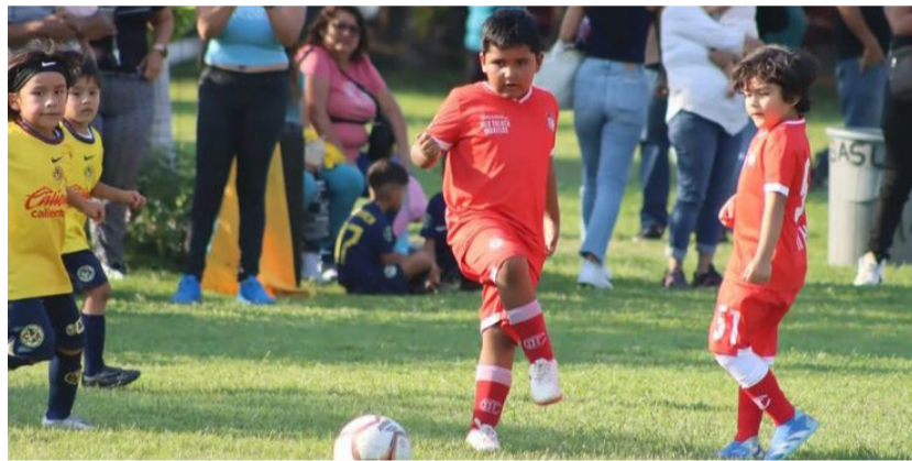
EL PASADO JUEVES, la FILIAL del CLUB TOLUCA FC se enfrentó a una escuela de fútbol.