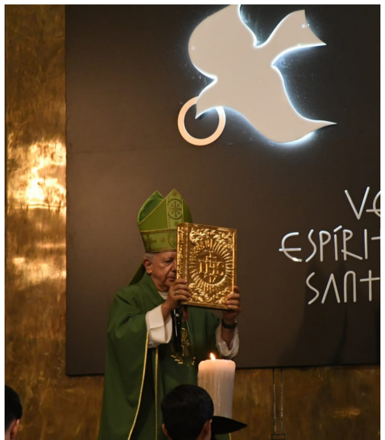
ANTE AUMENTO DE violencia en Morelos y Sinaloa, la iglesia católica pidió orar por la paz en dichos estados del país.

vir al pueblo y no para manipular, imponer e oprimir.