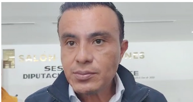
EL CONGRESO DE Morelos, a través de sus diputados, está a la espera de la actualización de las Leyes de Ingresos y las Tablas Catastrales, un proceso que se considera fundamental para el correcto funcionamiento económico y fiscal de los municipios de la entidad.