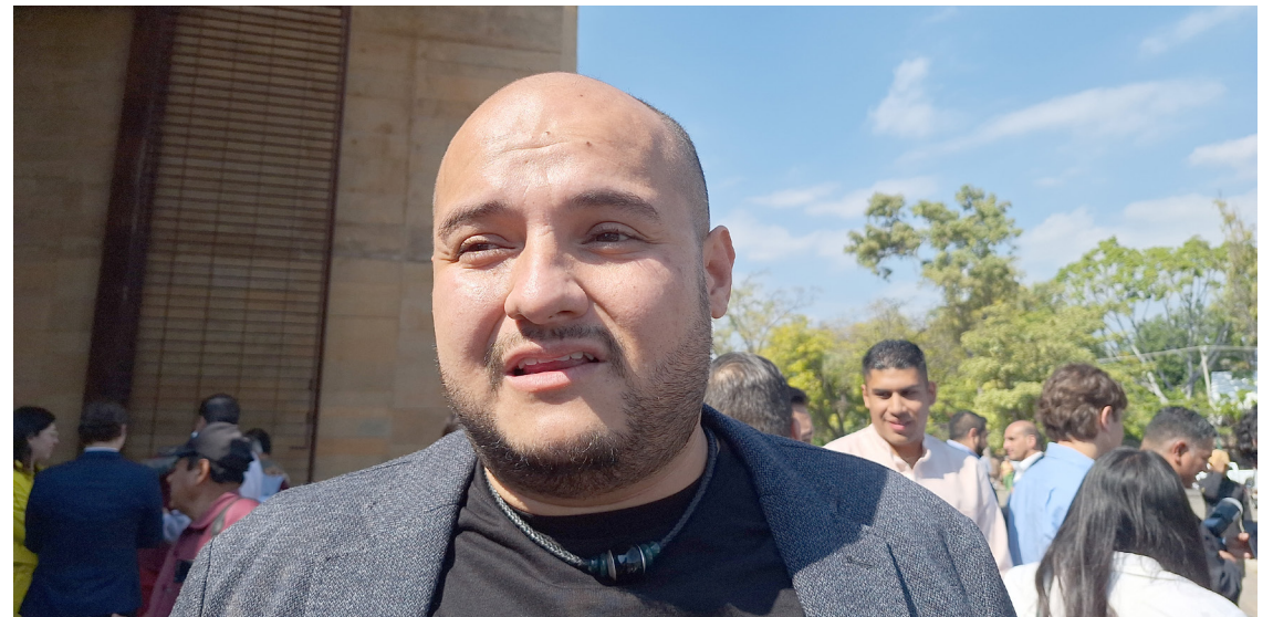
POR SEGURIDAD, EL Gobierno del estado pidió a los adolescentes que busca de empleo a no acudir a entrevista solos.

Finalmente, Pimentel hizo un llamado a las autoridades municipales y a los ciudadanos a mantenerse informados sobre el proceso de actualización, pues considera que esta acción es un paso importante para lograr una gestión más eficiente de los recursos públicos y mejorar las finanzas municipales.