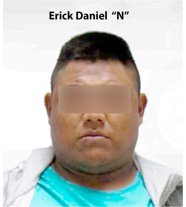
Erick Daniel "N"

trasera sacó un arma de fuego de entre sus ropas con la que amenazó al conductor para obligarlo a bajar del taxi, mientras su coautor condujo para escapar del lugar. Resultado de las investigaciones desarrolladas se logró establecer la identidad de uno de los participantes en los hechos, lo que permitió que el Ministerio Público obtuviera una orden de aprehensión, cumplimentada por personal de la AIC en contra de Marco Antonio "N" de 25 años de edad. En audiencia inicial, la Fiscalía Metropolitana formuló imputación en su contra por el delito de robo de vehículo automotor agravado, vertiéndose el acervo probatorio respectivo, y se programó para las siguientes horas la audiencia de vinculación a proceso y prevalece la prisión preventiva en su contra. Adicionalmente, Marco Antonio "N" fue vinculado a proceso por el delito de robo de vehículo cometido el 11 de enero de este año, cuando en compañía de José Luis "N" despojaron en la colonia Otilio Montaña del municipio de Jiutepec a la víctima de un vehículo tipo Tsuru, modelo 2004.