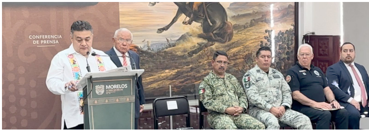
DESDE EL PASADO fin de semana se encuentran en Morelos elementos de la Secretaría de Marina para combatir a la delincuencia en los municipios de Emiliano Zapata, Xochitepec, Ayala, Jojutla y Puente de Ixtla.