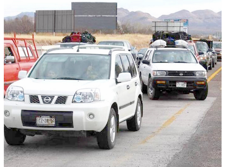
LA ASOCIACIÓN DE MEXICANOS en Carolina del Norte Inc. (Amexcan) lamentó la violencia y la inseguridad que está afectando a los paisanos en su retorno a México y exigió a los tres órdenes de gobierno acciones inmediatas de protección.

Se espera la llegada de unas 150 mil familias que lleguen en plan vacacional a municipios como Axochiapan, Miacatlán, Ocuituco, Cuautla, Temixco, Xochitepec y Zacatepec, Cuautla, Ayala, entre otros. “La Sedeso, el Instituto Nacional de Migración (INM) y los ayuntamientos estamos coordinados para procurar que a su regreso, los morelenses que viven en el extranjero tengan un descanso sin problemas”, afirmó.