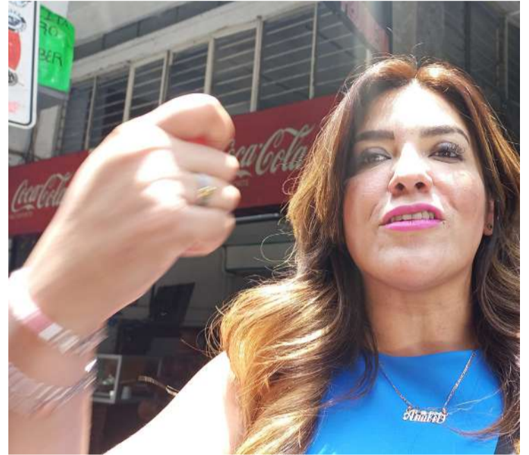
ACTUALMENTE 10 MUJERES de 14 a 16 años tienen brazalete de seguridad por ser víctimas de la violencia en el noviazgo.

Indicó que existe responsabilidad de las personas para evitar la acumulación de agua en diferentes objetos para frenar cacharros y la proliferación del vector transmisor del dengue.