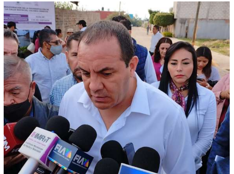
EL PRESIDENTE DE LA REPÚBLICA, Andrés Manuel López Obrador vendrá mañana a Morelos para supervisar el proyecto de la autopista La Pera-Cuautla, y saber la fecha en que será inaugurada en beneficio de miles de habitantes, informó el gobernador Cuauhtémoc Blanco Bravo.

“Pero cada quien hace su evaluación, si el municipio considera que puede con el tema de la seguridad como aquí en Cuernavaca, pues adelante, el estado estará pendiente de las solicitudes de apoyo cuando se ha dado, cuando así lo ha requerido el municipio, próximamente incluso vamos a celebrar en Cuernavaca una mesa regional de seguridad precisamente en la que se estarán integrando varios municipios entre ellos al de Cuernavaca”, concluyó Sotelo Salgado