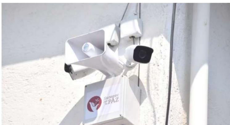
POR INSTRUCCIONES del alcalde Rafael Reyes, personal de la Dirección de Prevención del Delito del Gobierno con Rostro Humano de Jiutepec realizó la instalación de alarmas vecinales en nueve centros de población del municipio.

de la población los números de teléfono: 911 y 777-321-15-25 para reportar emergencias y solicitar apoyo a la corporación policiaca; se advierte a los usuarios no realizar llamadas de broma.