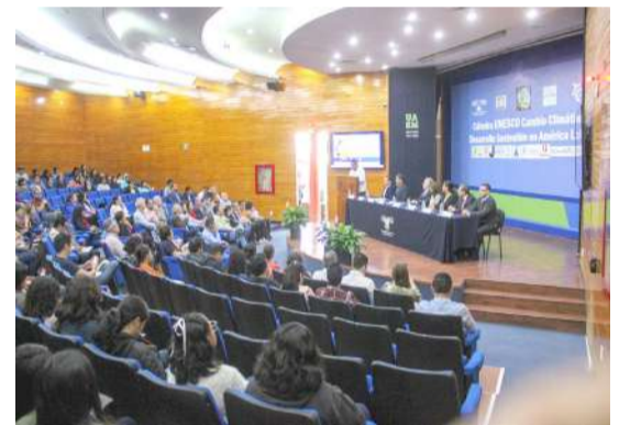
EL GOBIERNO DE MORELOS, a través de la Secretaría de Desarrollo Sustentable (SDS), aportó diez artículos de opinión y difusión sobre el trabajo que realiza la dependencia en la sustentabilidad, así como la mitigación y adaptación al cambio climático.