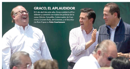
GRACO, EL APLAUDIDOR 115 años de Graco Ramírez, Gobernador de Morelos y conculca con todos los presidentes de México: Héctor Aguilar, Gobernador del Estado de Morelos, José Ruiz, del Gobierno y el Secretario Ruiz, Figuerza, Foto: Cortesimex

El linchamiento se ha vuelto común en el diálogo político estatal al grado que ya se observa con naturalidad: los poderes pelean entre sí, lo hacen por dinero, por control político, por cuestiones electorales y hasta por diferencias personales; lo mismo sucede con los actores de la vida pública, los partidos y los ciudadanos.