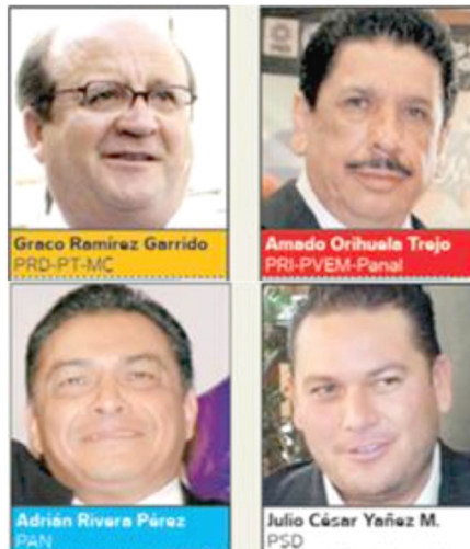
CERRADO. De acuerdo con la encuesta en vivienda de EL UNIVERSAL, aplicada del 19 al 21 de mayo, si las elecciones se hubieran realizado en esos días, el perredista obtendría 39.7% de los votos y el priista 38.2%.

Para el 2024 hay una lista de al menos diez mujeres y hombres de distintos partidos que quieren competir y casi todos ellos tienen identidad y raíces; Morena tiene algunos buenos perfiles y desde la oposición también podemos tener una buena oferta. Aunque nada está escrito, la boleta electoral del 2024 podría no ser tan mala como las de las dos contiendas estatales anteriores. Al menos veríamos a gente de aquí.