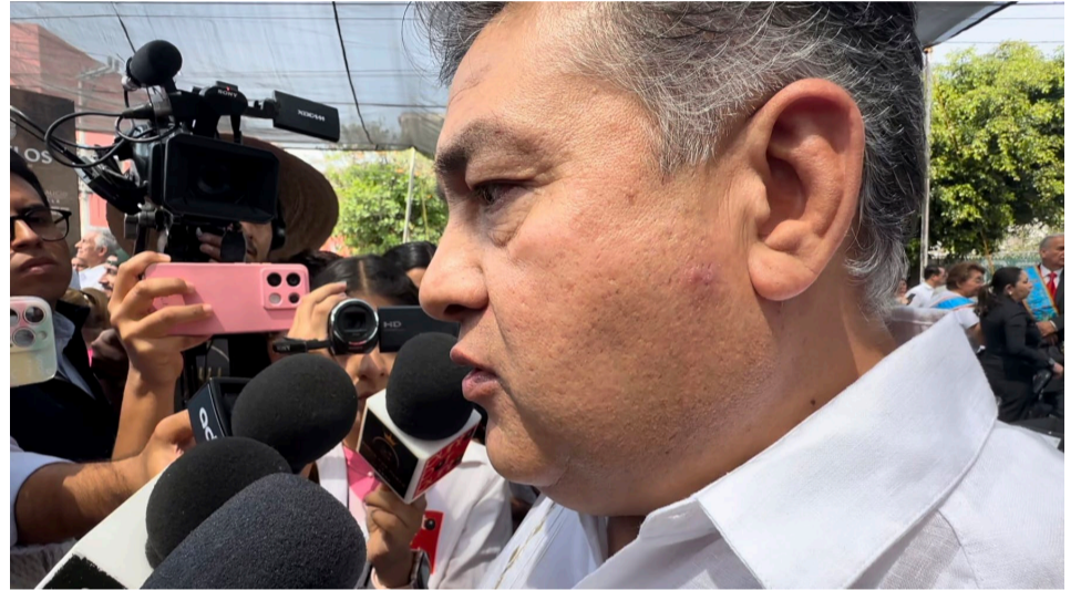
CUERNAVACA, YECAPIXTLA Y Temixco, son focos rojos en donde se reforzará la seguridad para la elección de ayudantes municipales durante este fin de semana.

reportados en Temixco y en Cuernavaca también va a tener mucha situación de seguridad”, concluyó Urrutia Lozano. Y es que cabe mencionar, que durante este fin de semana habrá elecciones de ayudantes municipales en diferentes localidades, incluida Cuernavaca que es el municipio que tendrá un mayor número de casillas.