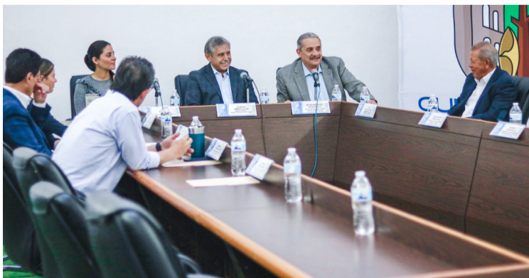
DURANTE EL ENCUENTRO celebrado en el municipio de Jiutepec, el alcalde, acompañado de la gobernadora del estado de Morelos, Margarita González Saravia, destacó la importancia de las alianzas interinstitucionales como estrategias clave para lograr resultados concretos en materia de seguridad pública y prevención de la incidencia delictiva.

A pesar de que, no tiene reporte de tortillerías donde utilicen maíz transgénico, el líder pidió a las autoridades a impedir la importación del maíz que venga de otros países para evitar su invasión y que sólo se manejen maces criollos nativos de los estados de Guerrero.