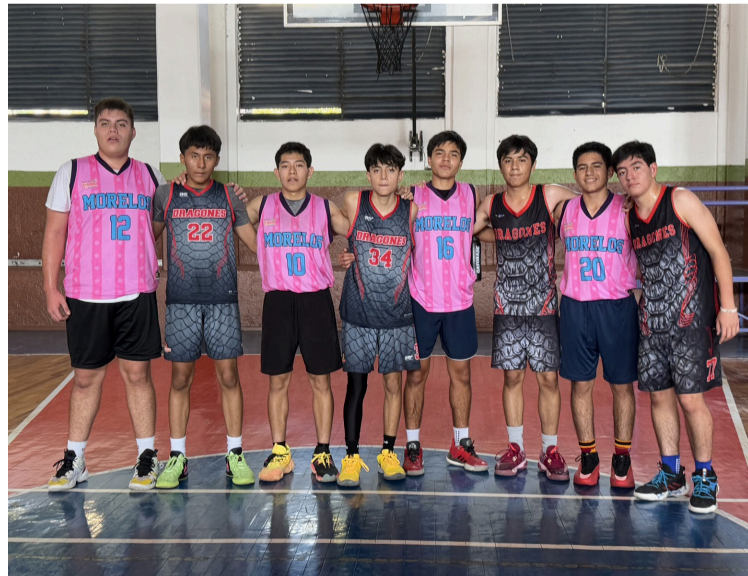
CON LA PARTICIPACIÓN de 72 equipos provenientes de diferentes municipios del estado de Morelos, se llevó a cabo la etapa estatal de básquetbol 3x3, en la unidad deportiva Revolución en el municipio de Cuernavaca, con rumbo a los Nacionales Conade 2025.