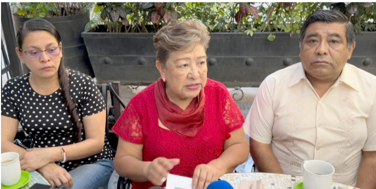
VECINOS DE LA colonia Satélite del municipio de Cuernavaca solicitaron el apoyo del Gobierno del estado para regularizar sus predios, ya que hay más de 250 familias que no tienen escrituras de sus propiedades.

Cabe mencionar, que el magistrado presidente informó en días pasados que la ESAF inició con una auditoría especial para revisar las finanzas durante los años en los que ha estado al frente del tribunal.