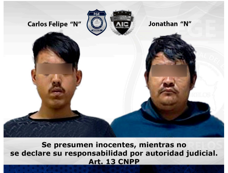
Se presumen inocentes, mientras no se declare su responsabilidad por autoridad judicial. Art. 13 CNPP

año, cuando llegaron a un mini-súper ubicado en el poblado de Santa María, del municipio de Cuernavaca, en donde amenazaron con arma de fuego a una mujer para despojarla de una camioneta marca Jeep, modelo 2024, color rojo, a bordo de la cual se dan a la fuga.