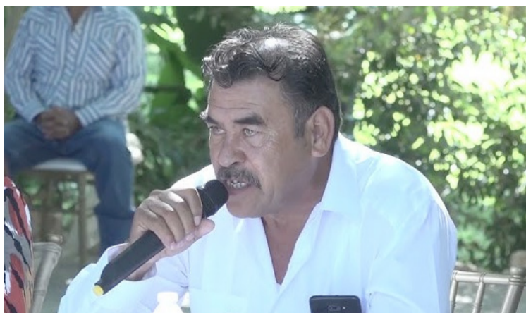
SERÁ POSITIVO QUE la gobernadora Margarita González Saravia envíe la terna de aspirantes a la presidencia municipal de Tepalcingo al Congreso del Estado para evitar una crisis política, luego de la anulación el año pasado de la candidatura del presidente municipal.

Aseguró que, de ser elegido él, su objetivo sería dar continuidad al trabajo que se ha venido realizando en el municipio y seguir avanzando en los proyectos en curso.