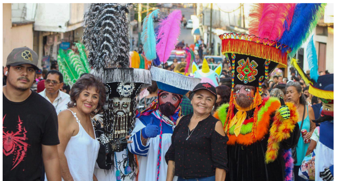
CON LA PARTICIPACIÓN de más de 200 comparsas y cerca de dos mil 500 chinelos, las calles del municipio de Jiutepec se llenaron de música, color y alegría para recibir a más de 25 mil visitantes en el arranque de la temporada de carnavales 2025 en Morelos.