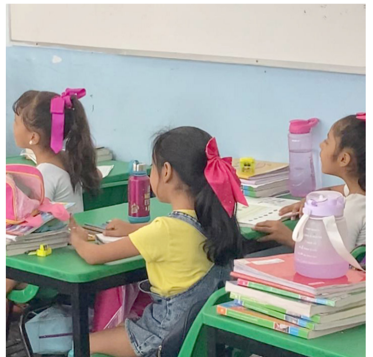
ANTE EL PRÓXIMO proceso de preinscripciones para el siguiente ciclo escolar, la Asociación de Padres de Familia solicita la intervención del IEBEM, para evitar las cuotas escolares que exigen algunas escuelas.

Lamentó que, sigan presentándose este tipo de caso y permitan a las escuelas primarias o secundarias públicas, se exija un dinero a cambio de algún trámite o documentación, puesto que, no es obligatorio para que los niños puedan ingresar a la educación formal.