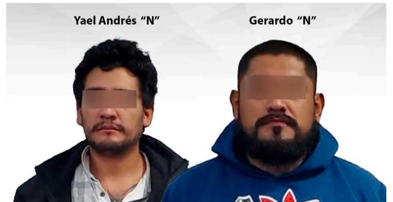
Se presumen inocentes, mientras no se declare su responsabilidad por autoridad judicial. Art. 13 CNPP

Italika tipo DM250, color naranja con negro, con permiso de circular del estado de Guerrero. En la audiencia de vinculación, el juez de la causa ordenó mantener a los dos imputados bajo la medida cautelar de prisión preventiva, al tiempo de fijar plazo de un mes para la investigación complementaria.