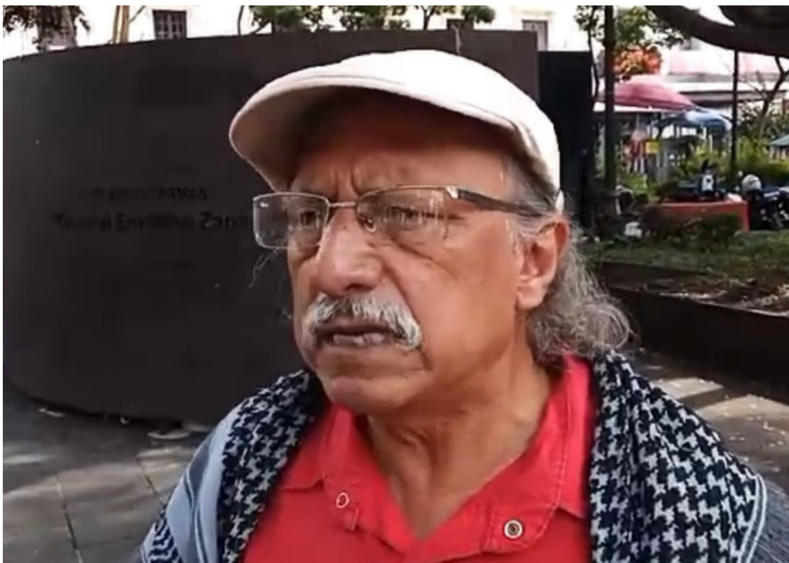
TRAS LA APROBACIÓN de la reforma de la Guardia Nacional para que ésta forme parte de la Secretaría de la Defensa Nacional, la CIDH consideró que se trata de un retroceso para el país, además de que generará más violaciones a los derechos humanos.