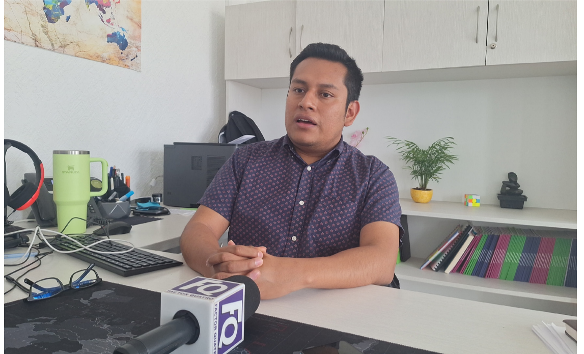
DE LOS 31 mil 586 morelenses cuya credencial de elector perdió vigencia en el 2023, sólo 11 mil han acudido a renovar su documento oficial, informó el Instituto Nacional Electoral (INE) Morelos.

Pero desde el 3 de junio se perdió la vigencia de los plásticos y fueron excluidos del Padrón Electoral y Lista Nominal Electoral, finalizó Valentín Salazar.