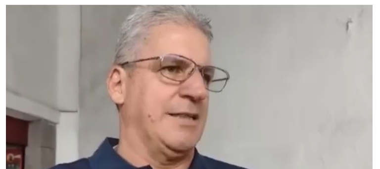
ANTE EL INCREMENTO de los asesinatos en Cuernavaca, empresarios lamentaron la falta de coordinación entre autoridades locales para combatir a los grupos criminales, por lo que exigieron la urgente intervención de las fuerzas federales.