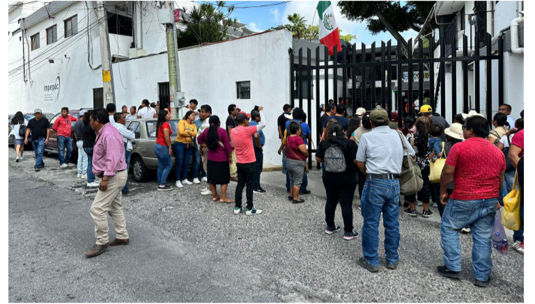
HABITANTES DEL MUNICIPIO indígena de Xoxocotla se manifestaron en el Instituto Morelense de Procesos Electorales y Participación Ciudadana (Impepac) para exigir que no se infle el padrón electoral rumbo a la elección del próximo 6 de octubre.

Cabe mencionar, que los manifestantes cerraron la avenida Morelos y Galeana para presionar a las autoridades del Impepac, lo que ocasionó un intenso caos vehicular durante varias horas en la zona.