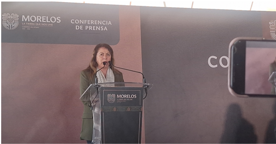
EN LOS CARNAVALES se ha rebasado la venta de alcohol, señaló la gobernadora Margarita González Saravía.

También pidió prudencia y paciencia ante la incertidumbre sobre una deportación masiva de conacionales.