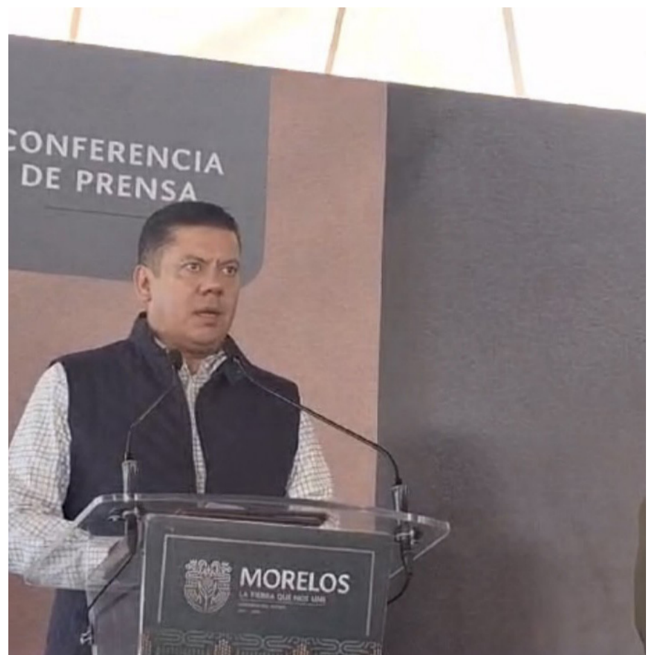
HASTA 11 COMUNIDADES indígenas, 27 rurales y diferentes colonias de Cuernavaca no cuentan con el servicio de agua potable, de acuerdo con la Comisión Estatal del Agua (Ceagua).

Indicó que, la firma de acuerdo está enfocado al aprovechamiento del agua, trabajar en el saneamiento de los ríos, lagos y lagunas, así como fomentar la reutilización del vital líquido con el objetivo de atender las necesidades para el consumo humano y el aprovechamiento del agua potable.