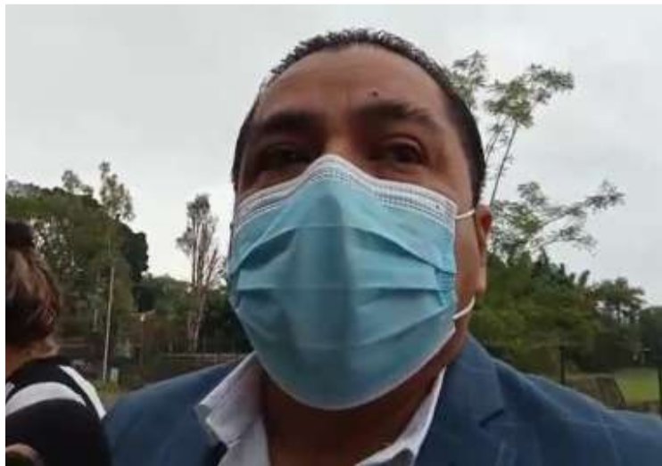
EN UN 14 POR CIENTO incrementó la pobreza en Morelos debido a la pandemia del covid-19, principalmente en los municipios indígenas.

“Lamentablemente los municipios más lastimados son los municipios indígenas que son las zonas de atención prioritaria en donde nosotros detectamos un mayor índice de población con pobreza, pero estaremos trabajando para ver la manera de fortalecer su economía con el presupuesto del 2023, también hay algunas comunidades que están en pobreza como es el caso de algunas en Tlalnepantla, municipios que no son propiamente indígenas pero que sí tienen comunidades en pobreza y que estaremos atendiendo”, concluyó Sotelo Martínez.