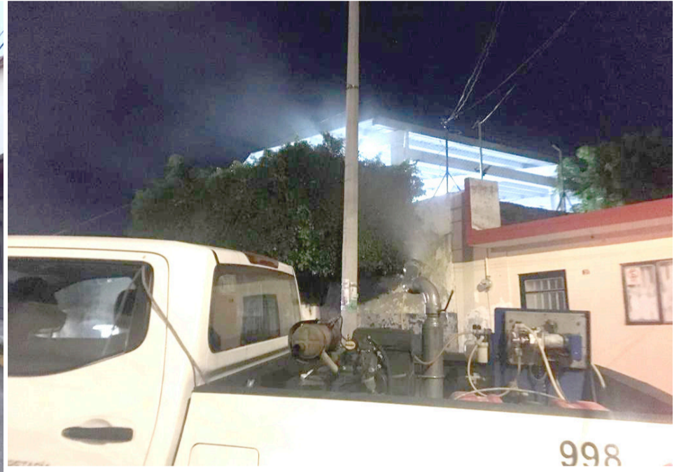
LOS SÍNTOMAS DEL DENGUE son: dolor de cabeza intenso, abdominal, en articulaciones, muscular y detrás de los ojos; vómito o pérdida del apetito; fiebre, sarpullido y náuseas; en caso necesario deben acudir al centro de salud más cercano.