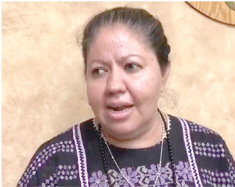
ANTE LA CERCANÍA de la temporada navideña, restauranteros de Morelos iniciaron a ofrecer sus paquetes de cenas para Navidad y Año Nuevo.

La funcionaria federal alertó a no dejarse engañar por falsos inspectores de verificación que lleguen a presentarse con documentación apócrifa de la Profeco.