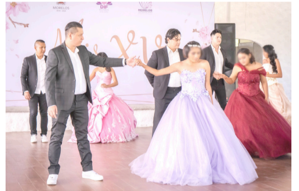
EL SISTEMA ESTATAL DIF Morelos realizó una vez más su tradicional celebración de XV años; esta acción se suma a todas las iniciativas que se ejecutan en favor de la juventud morelense que más lo necesita, siempre velando por la niñez y juventud.