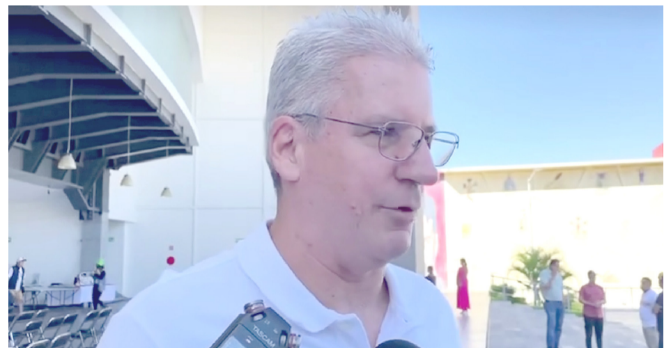
ANTE LOS ÚLTIMOS hechos de inseguridad registrados en Cuernavaca, empresarios exigieron que se intensifiquen los operativos de seguridad a la brevedad posible, ya que se pudiera afectar la llegada de turistas para la temporada navideña.

Y es que cabe mencionar, que en los últimos días se registraron asesinatos en avenidas como Río Mayo, Pericón y el Puente 2000, lo que los empresarios consideraron como una situación grave.