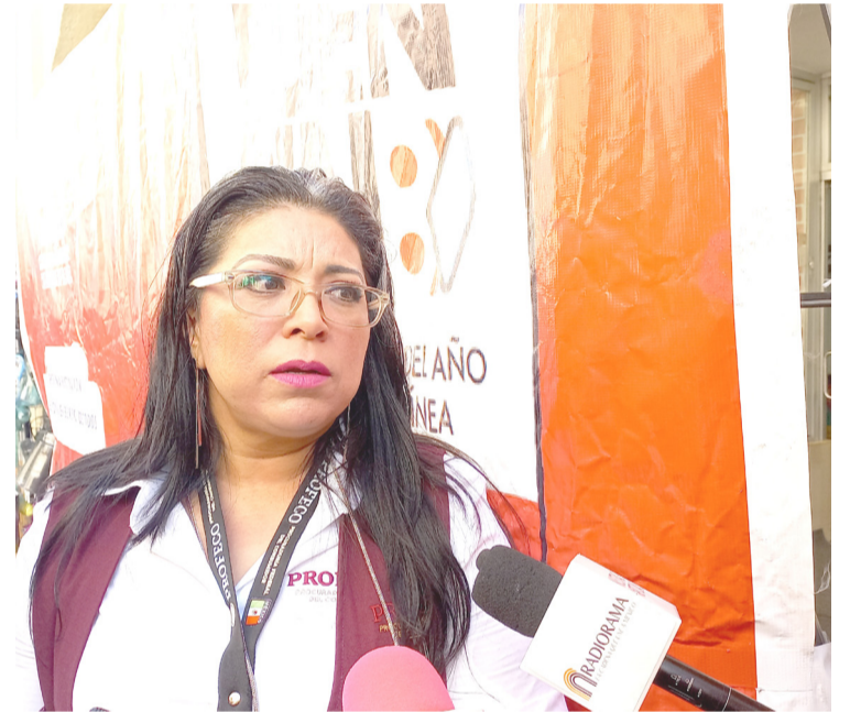
LA PROCURADURÍA FEDERAL del Consumidor (Profeco) delegación Morelos, alertó a la ciudadanía sobre personas que se hacen pasar por trabajadores de la dependencia para ofrecer algún trámite o pedir dinero.