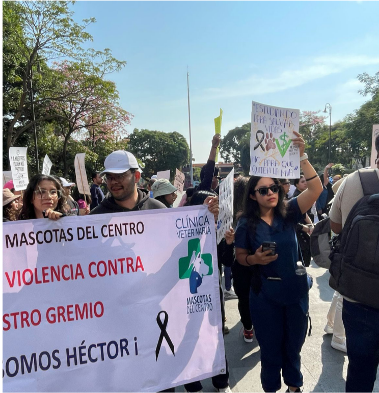
VETERINARIOS DE MORELOS se manifestaron en el Centro Histórico de Cuernavaca para exigir seguridad en el país, luego del asesinato de un veterinario registrado en días pasados en el Estado de México.