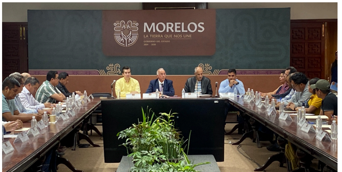
CON LA FINALIDAD de fortalecer el impacto del plan sexenal de obra pública planteado para los siguientes años en Morelos, el gobierno que encabeza Margarita González Saravia dio a conocer a las y los responsables de las áreas municipales de dicho rubro.