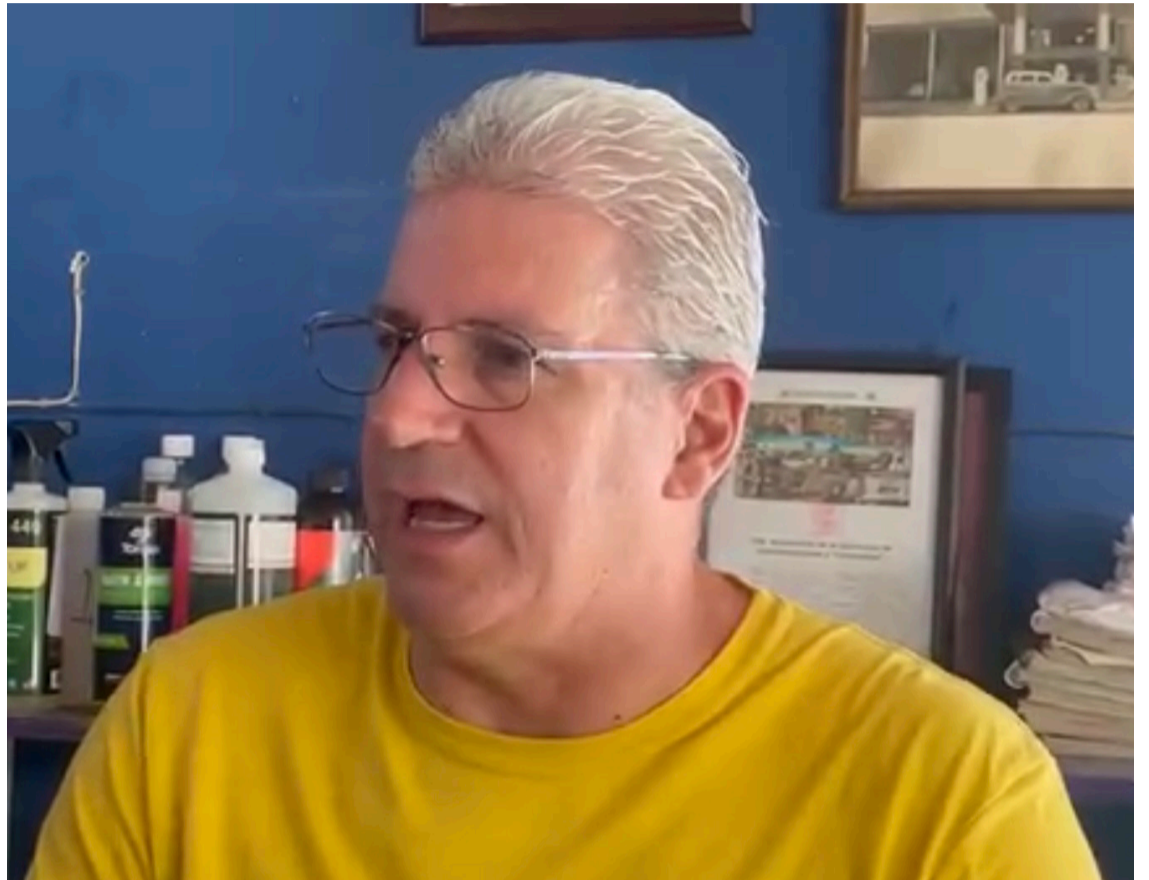
EMPRESARIOS AFIRMARON QUE es urgente la designación del nuevo titular de la Secretaría de Protección y Auxilio Ciudadano de Cuernavaca, con el fin de no generar vacíos que aprovechen los grupos de la delincuencia para cometer más delitos.

Y es que cabe recordar, que la ex titular de la Policía en Cuernavaca renunció al cargo la semana pasada, por lo que el alcalde declaró que en breve habrá una terna de quienes pueden encabezar el cargo.