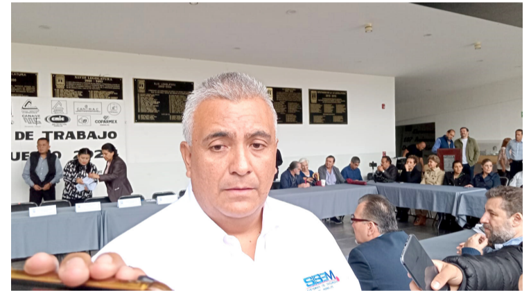
ANTE LOS CONSTANTES accidentes en la autopista y carretera federal México-Cuernavaca, empresarios morelenses pidieron a las autoridades implementar retenes para que los automovilistas y motociclistas respeten los límites de velocidad.

vigilancia de manera permanente. “Hacemos un llamado a la autoridad a que vigile y se cumpla los reglamentos de tránsito en la vía de comunicación, como lo es respetar los límites de velocidad, además de que sean carreteras seguras para transitar para las familias para que no se limite el turismo”, dijo el líder empresarial.