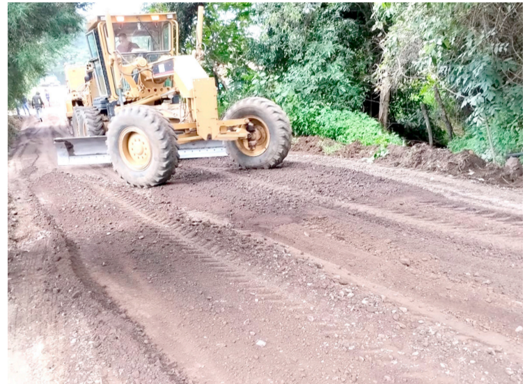
LA SECRETARÍA DE OBRAS Públicas, a través de la Dirección General de Caminos y Puentes, trabaja en la rehabilitación de la Ruta de Evacuación 3B del volcán Popocatepetl que corresponde al tramo carretero Tlalmimilupan - Ocuituco.