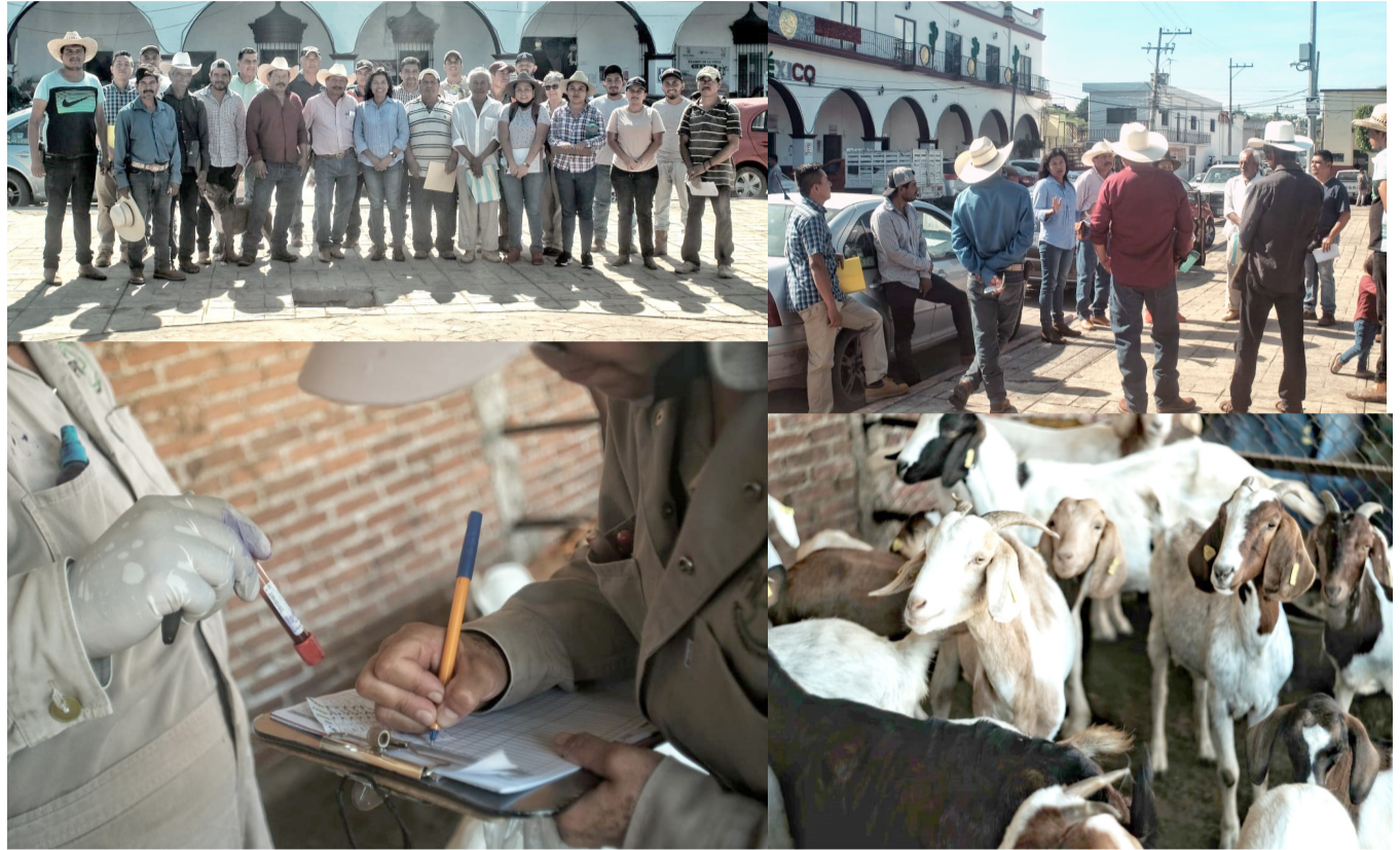
CON EL OBJETIVO de preservar la salud de los morelenses la Secretaría de Desarrollo Agropecuario, llevó a cabo la colocación del arete del Sistema Nacional de Identificación Individual de Ganado y pruebas de brucelosis a ovinos y caprinos en Tepalcingo.

Agradeció a especialistas y productores que participaron en estos trabajos en conjunto, estableciendo que este esfuerzo se enmarca en los lineamientos de las políticas para la atención al campo, del Gobierno que encabeza Cuauhtémoc Blanco Bravo. Finalmente, la funcionaria agregó que la brucelosis es una enfermedad zoonótica, por lo que exhortó a los ganaderos a realizar las medidas preventivas, estar pendientes de los síntomas, notificar de manera oportuna y llevar un control sanitario del ganado bovino.