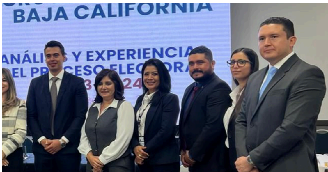
CON LA FINALIDAD de analizar e impulsar el fortalecimiento del derecho electoral desde la perspectiva de la impartición de justicia, procuración y derechos humanos, la FGE, participó en el Foro “Análisis y Experiencias del Proceso Electoral 2023-2024.