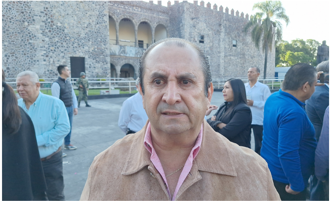
EN EL MARCO de cambios de gobierno municipales, la Secretaría de Gobierno advirtió posibles contratiempos y fricciones en los procesos de entrega-recepción.

"Estamos tendiendo puentes para que se haga una transición en orden, pero hay municipios muy cerrados que se van a convertir en focos rojos y van a ser una problemática para el Gobierno del estado de enfrentamiento social, pero vamos a tratar de que sean los menos", dijo el funcionario estatal.