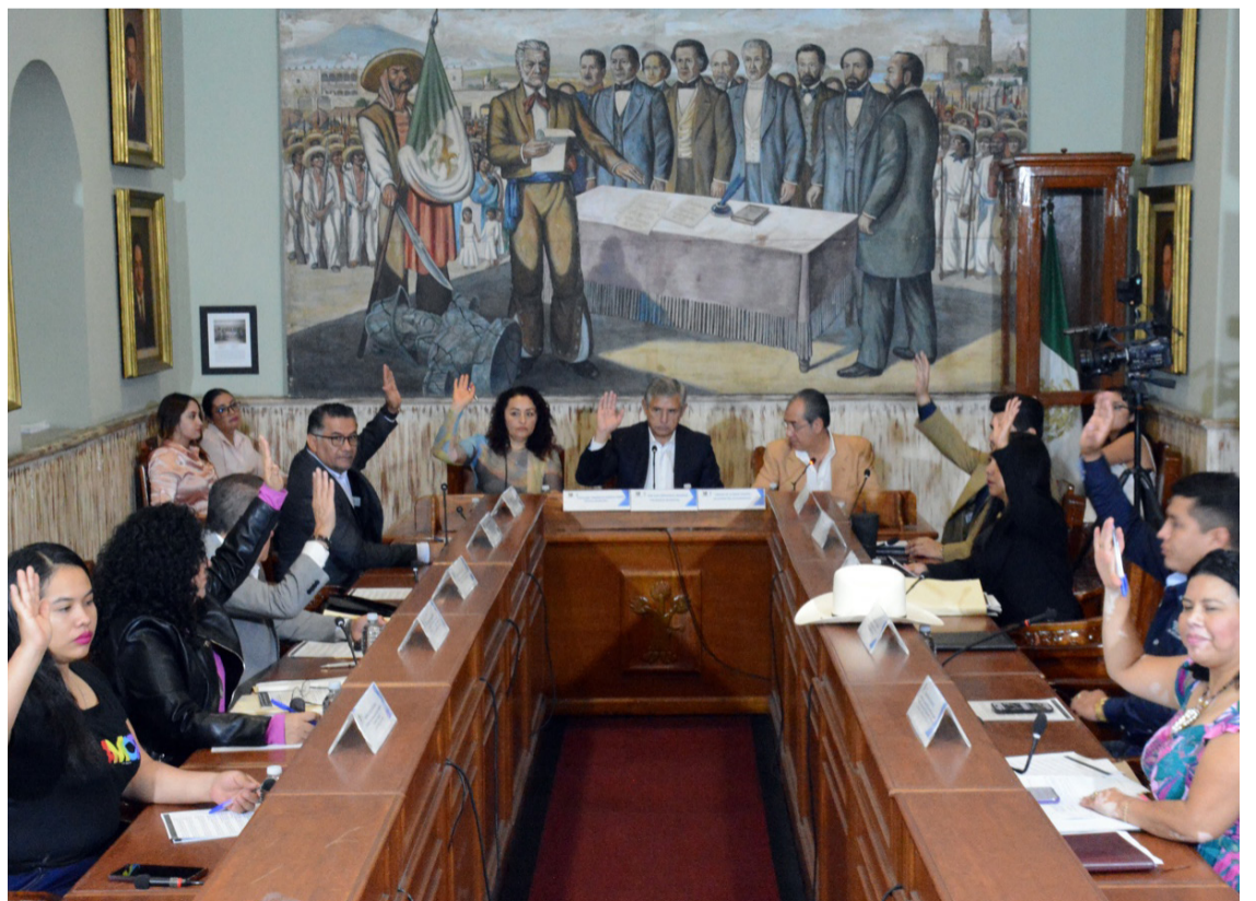
EL CABILDO DEL Ayuntamiento de Cuernavaca cumple con los derechos laborales de la base trabajadora en la administración 2022-2024, autorizando solicitudes de pensiones para aquellos trabajadores que dedicaron su vida al servicio de la población.