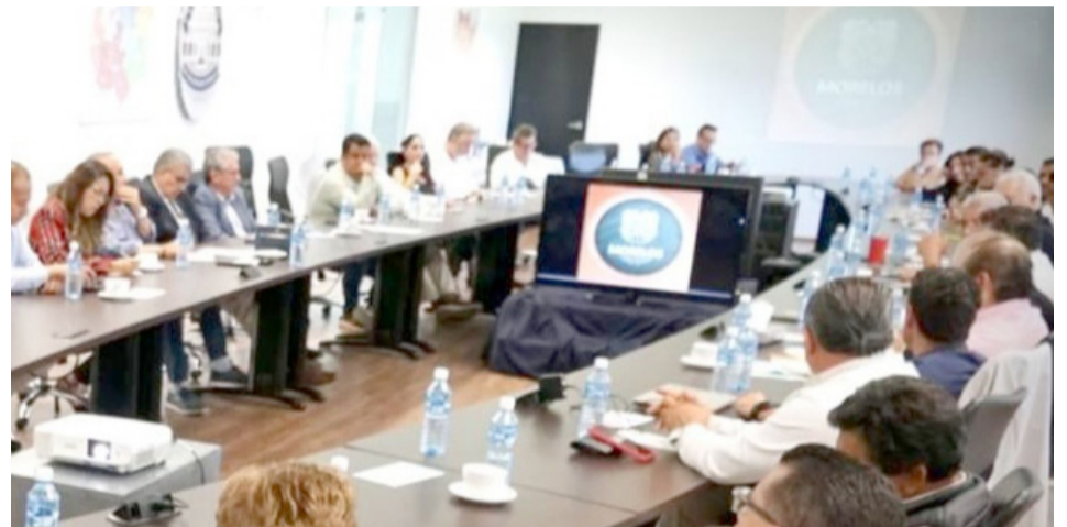
DESPUÉS DE CONOCER la estrategia integral de seguridad pública, un nutrido grupo de líderes empresariales coincidieron en coadyuvar por lo que definirán diversos estímulos para reconocer la labor de las y los buenos policías.