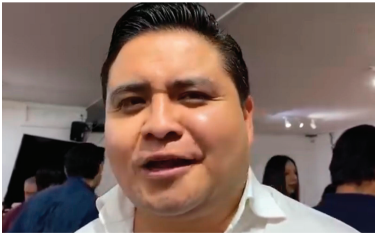
DURANTE ESTAS VACACIONES se solicitará el apoyo de la Guardia Nacional y del Ejército Mexicano para mejorar la seguridad en el municipio de Huitzilac, ante los hechos violentos que se han registrado en los últimos meses.

autorizada pero no vemos que la hagan, por eso estamos aquí metiendo presión al Ayuntamiento, es urgente que nos hagan la obra para contar con agua, no podemos seguir pagando pipas, así que ojalá y que con esta manifestación nos hagan caso, ya que de lo contrario volveremos a manifestarnos, estamos dispuestos incluso a cerrar calles para que nos hagan caso”, concluyó la vecina afectada.