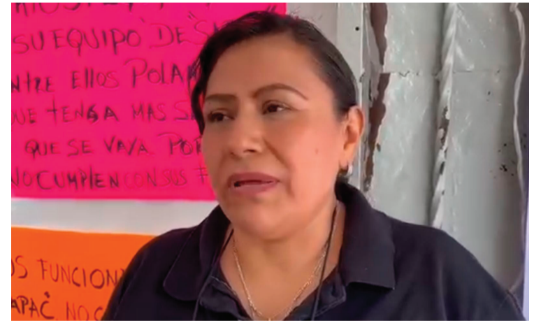
HABITANTES DE LA colonia Lomas de Cortés, se manifestaron en el Ayuntamiento de Cuernavaca para exigir el abasto de agua potable y la ampliación de la red, ya que más de 60 familias se ven afectadas por la falta del suministro.