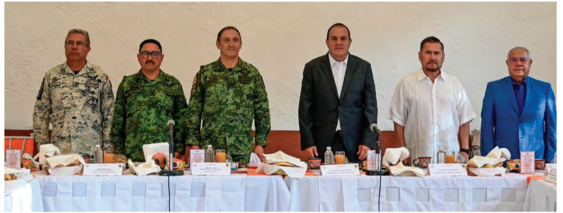
EL GOBERNADOR DE MORELOS, Cuauhtémoc Blanco Bravo, informó que el operativo de seguridad para estas vacaciones de verano, se intensificará más en aquellos sitios en donde más presencia de turistas se registre.

Y es que cabe mencionar, que en semanas atrás se han registrado peleas entre motociclistas en el poblado de Tres Marías, lo que genera una mala imagen para el turismo