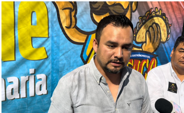
LA POLICÍA DEL municipio de Emiliano Zapata buscará detener a las personas que en los últimos días se han dedicado a envenenar a perros callejeros en diferentes colonias.