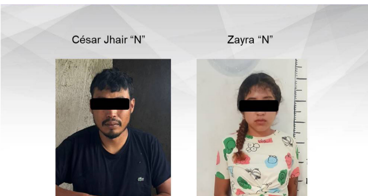
Se presumen inocentes, mientras no se declare su responsabilidad por autoridad judicial. Art. 13 CNPP