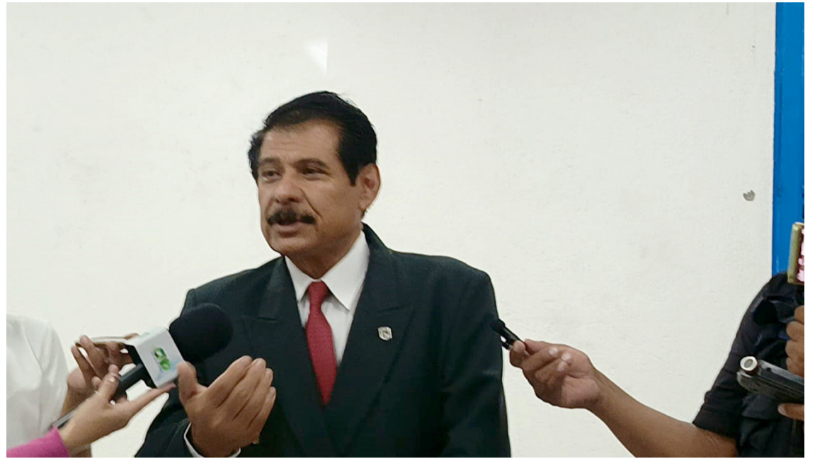
EL SINDICATO NACIONAL DE los Trabajadores de la Secretaría de Salud en Morelos sección 29 aseguró que está destruido el sistema de salud estatal.

Finalmente, explicó que se tendrán que hacer varias modificaciones a la ley Orgánica por lo que celebren la apertura de los diputados.