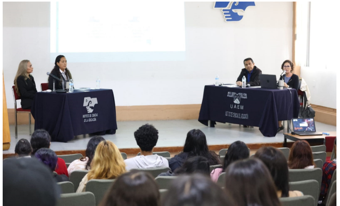
CON UNA SERIE de actividades académicas, culturales y recreativas, este 13 de septiembre se llevó a cabo la celebración de los 39 años de creación del Instituto de Ciencias de la Educación de la UAEM.