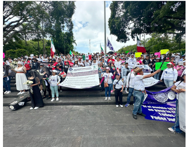
TRABAJADORES, JUECES Y magistrados del Poder Judicial de la Federación, mantendrán el paro de labores que iniciaron en contra de la reforma al Poder Judicial, hasta que haya una mesa de diálogo con el Consejo de la Judicatura Federal.