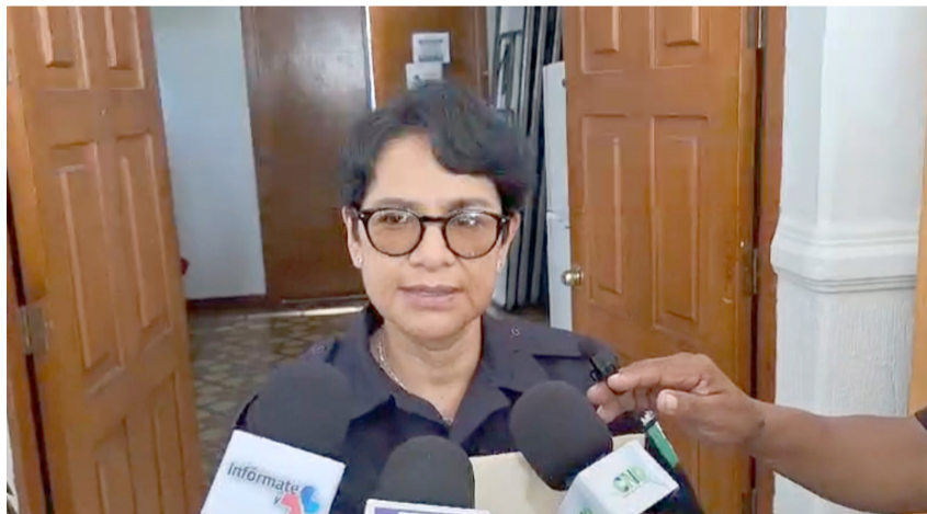
EN CUERNAVACA SE reportó saldo blanco durante la conmemoración de un aniversario más del inicio de la independencia de México, informó la Secretaría de Protección y Auxilio Ciudadano.