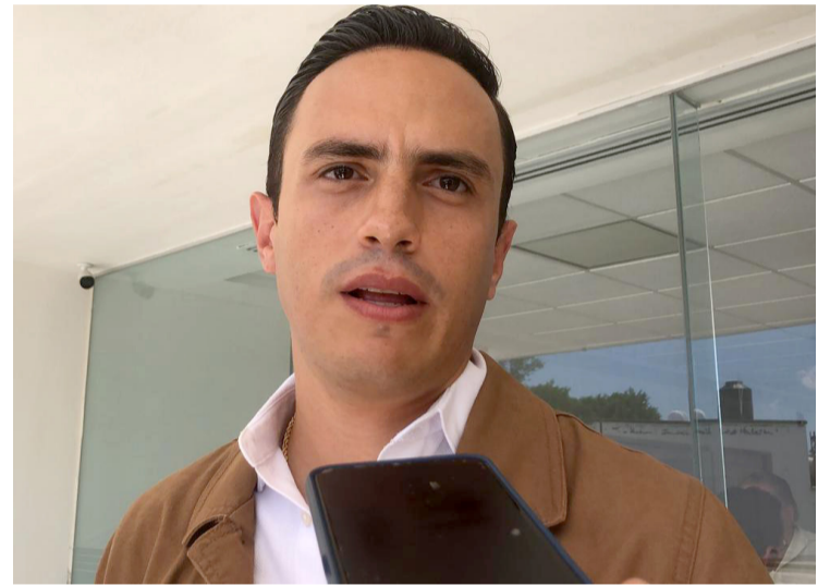
SUPERARÁ CON CRECES Los mil 700 millones de pesos pronosticados por el presidente del Tribunal Superior de Justicia

en el Congreso del Estado, donde se espera que se tomen decisiones que balanceen las necesidades del Poder Judicial con la capacidad económica del estado.