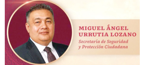
MIGUEL ÁNGEL URRUTIA LOZANO Secretaría de Seguridad y Protección Ciudadana

El futuro secretario de seguridad ha comenzado a dar muestras de lo que será su trabajo; Miguel Ángel Urrutia no es ningún improvisado, ni tampoco alguien que desconozca el estado. Su trayectoria es larga e incluye logros en temas sumamente complicados en la agenda nacional.