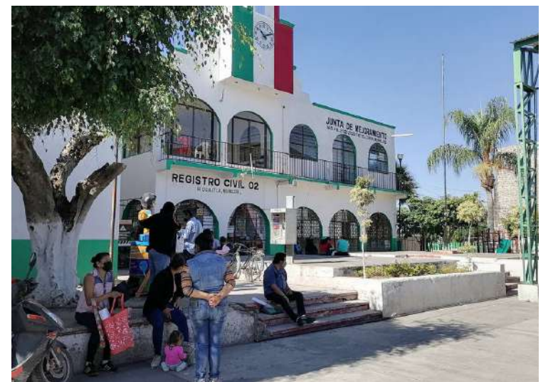
SERÁ ENTRE el 2 al 16 de diciembre cuando se lleve a cabo la consulta para la municipalización de Tetelcingo, y desde ahora se realiza una fase de deliberación para conocer el sentir de la población involucrada.

Al final, después de levantar el plantón, se acordó que habría una vigilancia en la manera de conducirse del director, para que en caso de que se diera algún hostigamiento o acoso, entonces se tomarían otras medidas en contra del directivo.