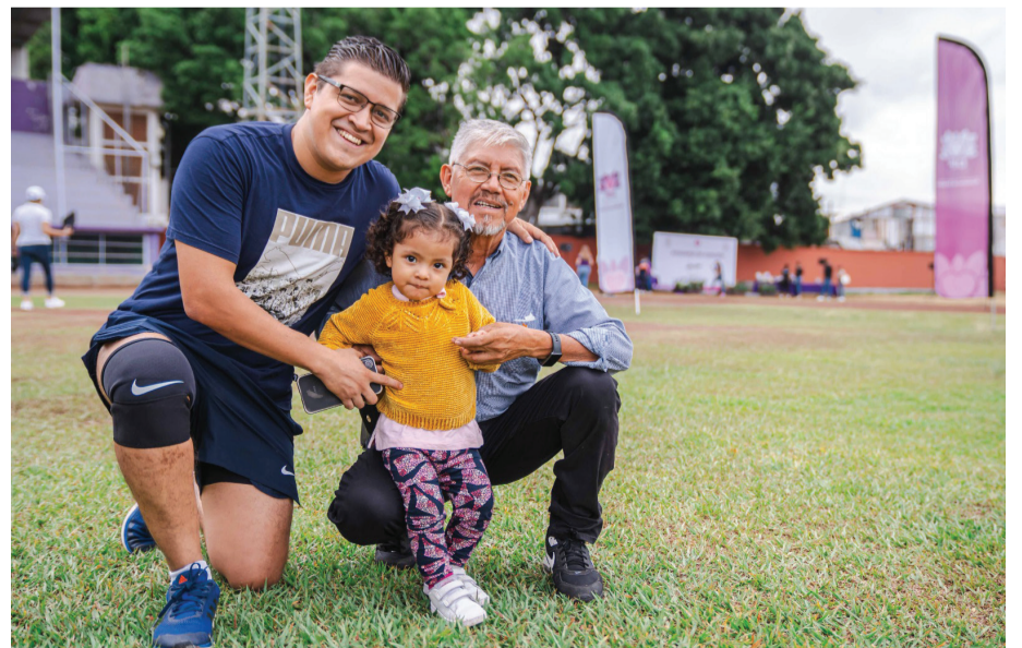
EN EL MARCO de la celebración del Día del Padre, el Sistema Estatal DIF Morelos llevó a cabo la tercera edición del rally “Un Papá de 10”, iniciativa que reunió, un año más, a padres de familia de todo el estado, para compartir momentos de sana convivencia.