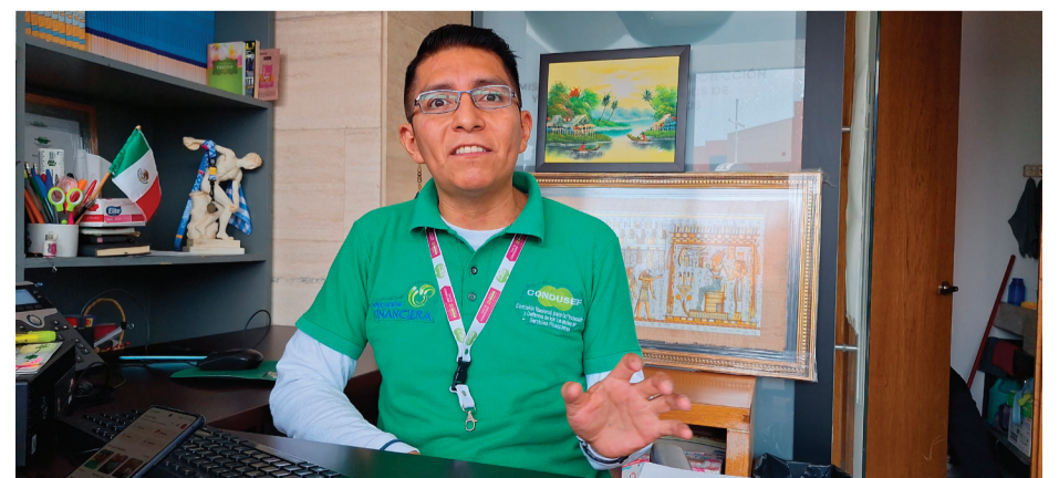
LA COMISIÓN NACIONAL para la Protección y Defensa de los Usuarios de Servicios Financieros (Condusef) en Morelos alertó sobre estafas por WhatsApp.