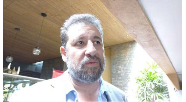
DE ACUERDO CON la Cámara Mexicana de la Industria de la Construcción (CMIC) en Morelos no hay inversión para las empresas constructoras.

mestre del año, no se percibe un avance en el estado en materia de infraestructura.