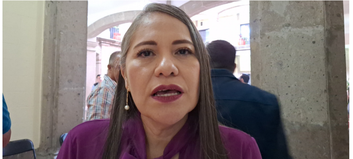
TAMBIÉN SE PRESUME malos manejos en la Secretaría de Administración durante el Gobierno de Cuauhtémoc Blanco Bravo.

ción. "Estamos terminando de integrar la información y analizando para poder verificar las posibles irregularidades", finalizó la funcionaria estatal.