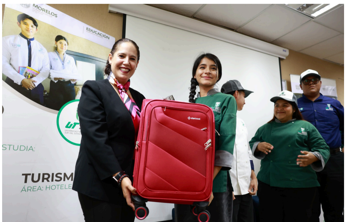
LA SECRETARÍA DE Educación, reafirma su compromiso con la formación integral e internacionalización educativa al facilitar que cinco estudiantes de Turismo y Gastronomía viajen a España para realizar una estancia académica de 15 semanas.